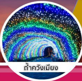
ถ้าคังเมียง