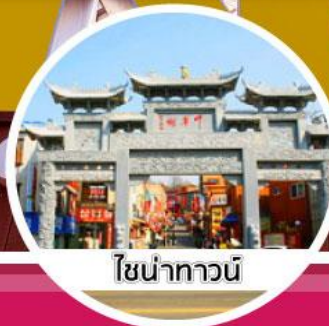
โซน่าทวอน