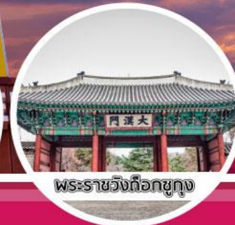
พระราชวังเดือกชุง