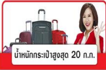
น้ำหนักกระเป๋าสูงสุด 20 กก.