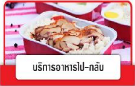
บริการอาหารไป-กลับ