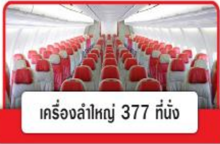
เครื่องลำใหญ่ 377 ที่นั่ง

***หมายเหตุ*** เคาน์เตอร์เช็คอินจะปิดบริการก่อนเวลาเครื่องออกอย่างน้อย 60 นาที และผู้โดยสารพร้อม ณ ประตูขึ้นเครื่องก่อนเวลาเครื่องออก 40 นาที (**ขอสงวนสิทธิ์ในการเลือกที่นั่งบนเครื่อง เนื่องจากต้องเป็นไปตามระบบของสายการบิน**)