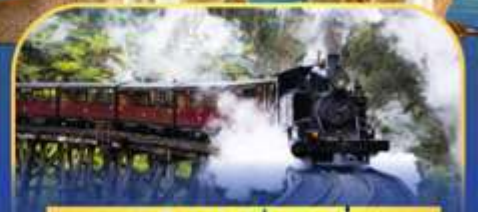
รถไฟพัพพิงบิลลี่

ล่องเรือชมอ่าวซิดนีย์พร้อมรับประทานอาหารกลางวัน และ เข้าชมสวนสัตว์การองก้า • ล่องเรือชมอ่าวซิดนีย์ • ชมโรงอุปรากรซิดนีย์ • เคินชมยามเคอะเรือกส์ • คินเนอร์ Half Lobster • บินเที่ยวบินภายในจากซิดนีย์สู่เมลเบิร์น • ชมขบวนพาหรรณกเพนกวิน • นั่งรถไฟหัวรถจักรไอน้ำ Puffing Billy • ช้อปปิงจุใจในนครเมลเบิร์น