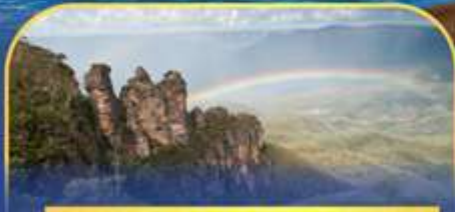
อุทยานแห่งชาติคูนันท์เก็นส์ Three Sister Rock