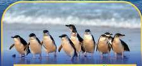
พาหรรณกเพนกวิน