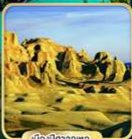
เมืองปิกางจู่เหอ