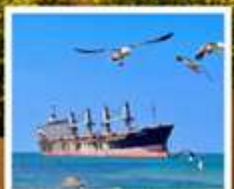
เรือสินค้ากยตึ้นบลูวิส