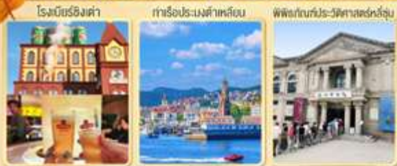
โรมันริ่งชิงเต่า

Premium Service บริการ Full Service (CZ) โพลีคาร์บอเนตที่เย็น อาหารดี ที่พักรับประทาน 4 ความสะดวกสบาย