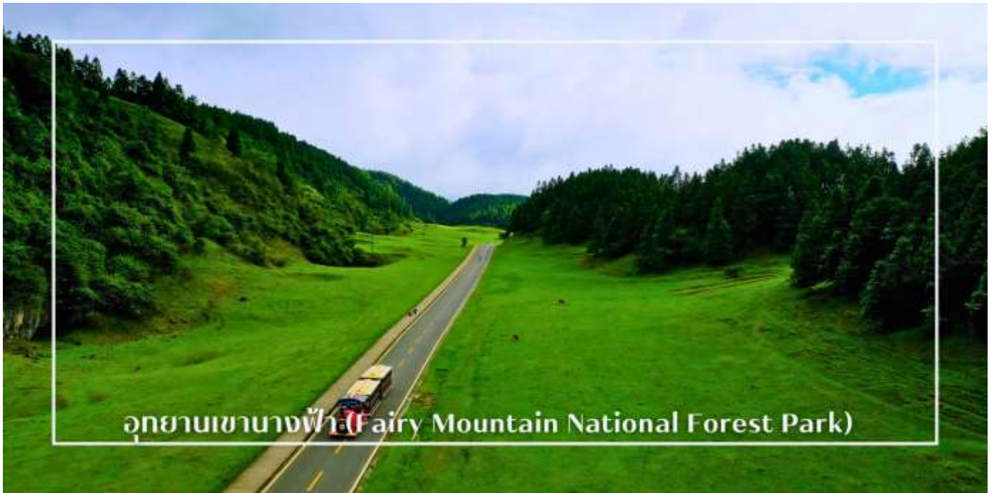
อุทยานเขานางฟ้า (Fairy Mountain National Forest Park)