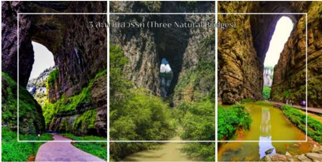
3 สะพานธรรมชาติ (Three Natural Bridges)