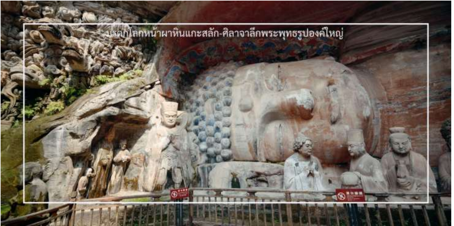
บรรดากโลกหน้าผาหินแกะสลัก-ศิลาจารึกพระพุทธรูปองค์ใหญ่