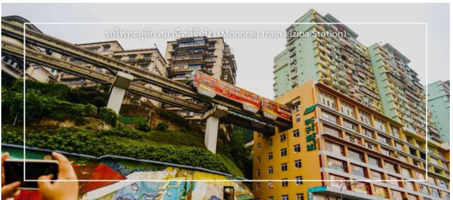
รถไฟทะลุตึก สถานีหลี่จื่อป้า (Monorail train Liziba Station)

นำท่าน นั่งรถไฟทะลุตึก (Monorail train Liziba Station) เป็นหนึ่งในประสบการณ์ที่น่าสนใจและเป็นเอกลักษณ์ในเมืองฉงชิ่ง รถไฟเส้นนี้มีเส้นทางที่ผ่านอาคารและที่อยู่อาศัย ทำให้ผู้โดยสารรู้สึกเหมือนกำลังนั่งรถไฟที่ทะลุผ่านตึกสูง เส้นทางที่น่าสนใจในรถไฟนี้รวมถึงสถานีที่มีชื่อเสียง เช่น สถานีหลี่จื่อป้า (Liziba Station) ซึ่งตั้งอยู่ในพื้นที่ที่มีความหนาแน่นของประชากร การนั่งรถไฟทะลุตึกนี้เป็นวิธีที่ยอดเยี่ยมในการสัมผัสกับวัฒนธรรมเมืองฉงชิ่งและชื่นชมกับการพัฒนาเมืองที่น่าทึ่ง หากคุณมีโอกาสดูเมืองฉงชิ่ง อย่าลืมลองนั่งรถไฟเส้นนี้เพื่อสัมผัสประสบการณ์ที่ไม่เหมือนใคร