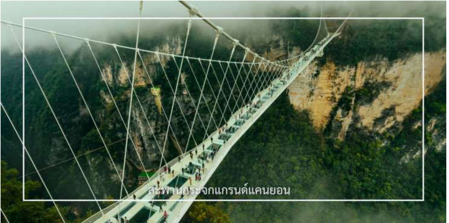
สะพานกระจกแกรนด์แคนยอน

สัมผัสประสบการณ์สุดตื่นเต้นกับการเดินบนสะพานกระจกใส ที่ทอดยาวเหนือหุบเขาสูง ให้ท่านได้ชมทัศนียภาพอันงดงามแบบพาโนรามา พร้อมท้าทายความกล้าท่ามกลางบรรยากาศธรรมชาติอันยิ่งใหญ่