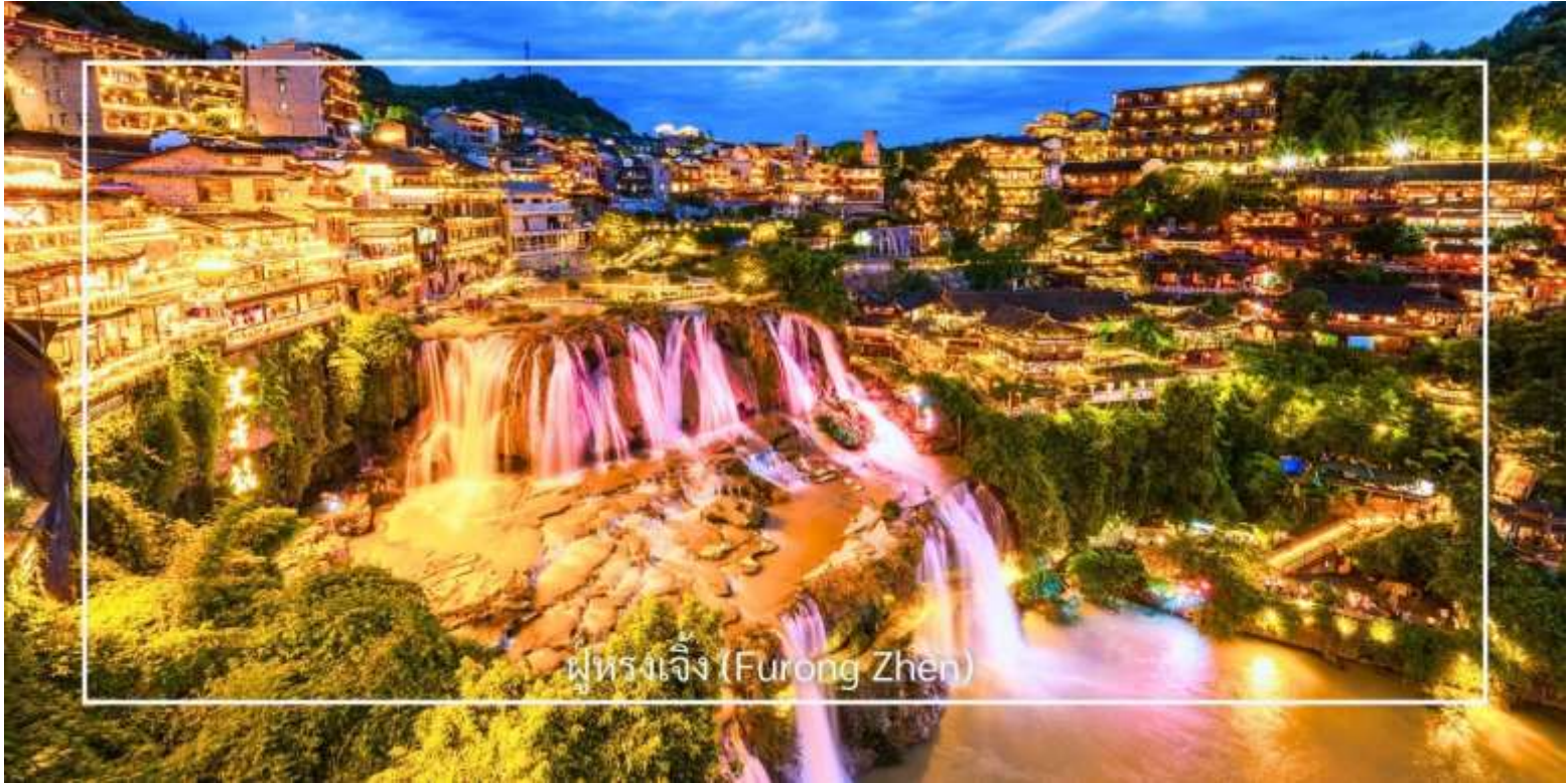
ผู่หรงเจิ้ง (Furong Zhen)

หรงเจิ้งมีประวัติยาวนานกว่า 2,000 ปี โดดเด่นด้วยบ้านเรือนไม้โบราณของชนเผ่าอู่เจียที่ปลูกเรียงรายริมหน้าผา และน้ำตกขนาดใหญ่ที่ไหลผ่านกลางเมืองอย่างสง่างาม ภาพของละอองน้ำที่กระทบแสงไฟยามค่ำคืนที่สวยงาม ผสานกับสถาปัตยกรรมโบราณ สร้างบรรยากาศงดงามราวภาพวาด ชมน้ำตกผู่หรงเจิ้ง ที่สวยงามกลางเมืองที่เป็นจุดเช็คอินยอดนิยม