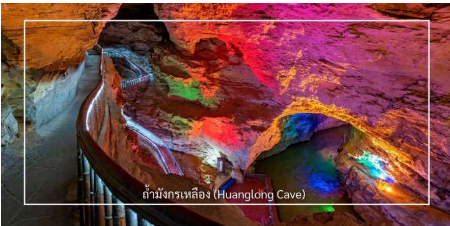
ถ้ำมังกรเหลือง (Huanglong Cave)

ถ้ำมังกรเหลือง หนึ่งในถ้ำหินงอกหินย้อยที่ยิ่งใหญ่และงดงามที่สุดของเมืองจางเจียเจี๋ย แหล่งท่องเที่ยวทางธรรมชาติที่ได้รับการยกย่องว่าเป็น “พระราชวังใต้พิภพ” แห่งดินแดนอุ่หลิงหยวน ถ้ำแห่งนี้มีโครงสร้างขนาดใหญ่ แบ่งออกเป็น 4 ชั้น ภายในประกอบด้วยห้องโถงกว้างใหญ่ ลำธารใต้ดิน บึงธรรมชาติ และแนวระเบียงหินที่ทอดยาวอย่างน่าตื่นตา ความมหัศจรรย์ของหินงอกหินย้อยซึ่งก่อตัวสะสมมาเป็นเวลาหลายล้านปี ได้รับการจัดแสงอย่างสวยงาม ช่วยขับเน้นรูปร่างแปลกตาให้โดดเด่นราวงานศิลป์จากธรรมชาติ สัมผัสประสบการณ์ ล่องเรือชมแสงสีภายในถ้ำ โดยเรือจะนำท่านลัดเลาะไปตามสายน้ำใต้ถ้ำให้ท่านได้สัมผัสกับความยิ่งใหญ่ของธรรมชาติอันน่าอัศจรรย์ได้อย่างใกล้ชิด