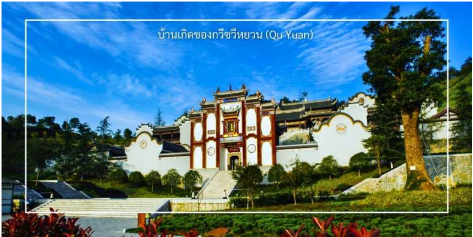
บ้านเกิดของกวีชวีหยวน (Qu Yuan)

นำท่านเดินทางสู่ ถนนคนเดิน CBD ย่านการค้าและสตรีทฟู้ดใจกลางเมืองอู่ฮาง แหล่งรวมอาหารท้องถิ่น เสื้อผ้าแฟชั่น และ ห้างสรรพสินค้ามากมาย เหมาะสำหรับเดินช้อปปิ้งและสัมผัสวิถีชีวิตคนเมือง