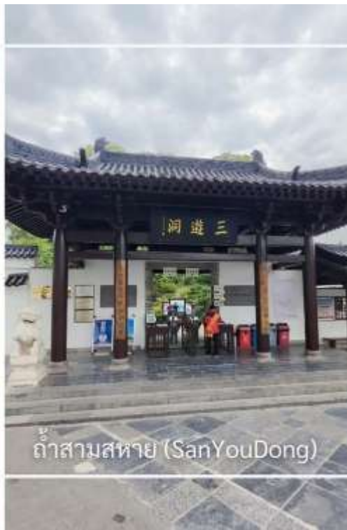
ถ้ำสามสหาย (SanYouDong)