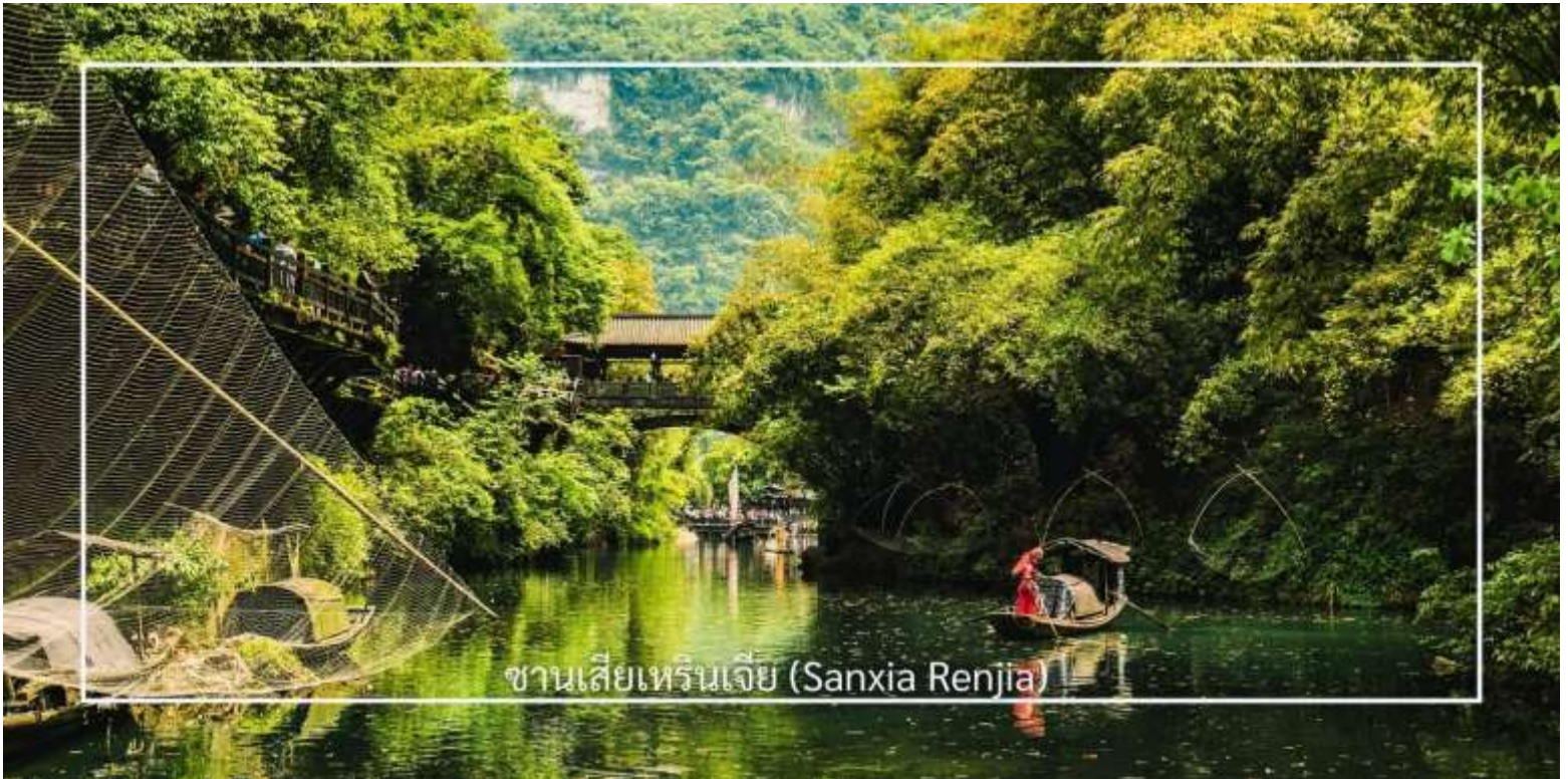
ซานเซียเหรินเจีย (Sanxia Renjia)

นำท่านสู่ หมู่บ้านซานเซียเหรินเจีย (Sanxia Renjia) (รวมล่องเรือ) สถานที่นี้เป็นที่รู้จักกันในชื่อ หมู่บ้านสามผา แหล่งท่องเที่ยวระดับ 5A ตั้งอยู่ในเขตหุบเขาสามผา ริมแม่น้ำแยงซีเกียง โดดเด่นด้วยทัศนียภาพทางธรรมชาติอันงดงามของภูเขา หินผา สายน้ำ และหุบเขาที่โอบล้อมกันอย่างกลมกลืน สถานที่แห่งนี้สะท้อนวิถีชีวิตดั้งเดิมของชาวลุ่มแม่น้ำแยงซีเกียง ผ่านสถาปัตยกรรมพื้นบ้าน วัฒนธรรม ประเพณี ที่ยังคงเอกลักษณ์ไว้อย่างครบถ้วน พร้อมให้ท่านได้ชมการแสดงเรื่องราวเกี่ยวกับวิถีชีวิตควบคู่กับสายน้ำ