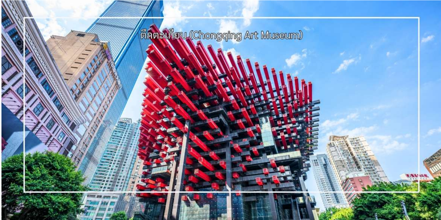
ตึกตะเกียบ (Chongqing Art Museum)

ทันสมัยและเอกลักษณ์เฉพาะตัว ทำให้ที่นี่กลายเป็นหนึ่งในสถานที่ที่ต้องมาเยือน