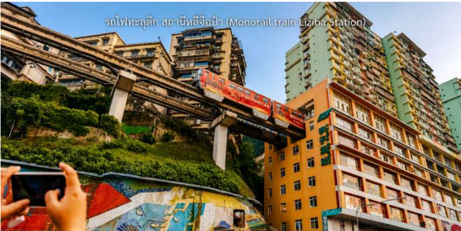
รถไฟทะลุติ๊ก สถานีหลี่จื่อป้า (Monorail train Liziba Station)

จากนั้นนำท่าน นั่งรถไฟทะลุติ๊ก (Monorail Train) หนึ่งในประสบการณ์ที่น่าสนใจและเป็นเอกลักษณ์ในเมืองฉงชิ่ง รถไฟเส้นนี้มีเส้นทางที่ผ่านอาคารและที่อยู่อาศัย ทำให้ผู้โดยสารรู้สึกเหมือนกำลังนั่งรถไฟที่ทะลุผ่านตึกสูง เส้นทางที่น่าสนใจในรถไฟนี้รวมถึงสถานีที่มีชื่อเสียง เช่น สถานีหลี่จื่อป้า (Liziba Station) ซึ่งตั้งอยู่ในพื้นที่ที่มีความหนาแน่นของประชากร การนั่งรถไฟทะลุติ๊กนี้เป็นวิธีที่ยอดเยี่ยมในการสัมผัสกับวัฒนธรรมเมืองฉงชิ่ง และชื่นชมกับการพัฒนาเมืองที่น่าทึ่ง หากคุณมีโอกาสไปเยือนฉงชิ่ง อย่าลืมลองนั่งรถไฟเส้นนี้เพื่อสัมผัสประสบการณ์ที่ไม่เหมือนใคร