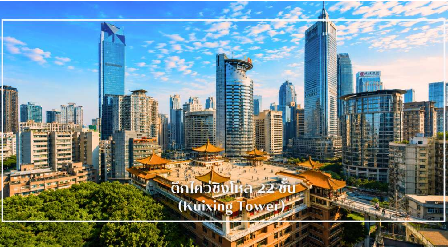
ตึกไควชิงโหล 22 ชั้น (Kuixing Tower)

หลังอาหารเข้านำท่านเที่ยวชม ตึกไควชิงโหล 22 ชั้น (Kuixing Tower) หนึ่งในแลนด์มาร์คสุดแปลกของนครฉงชิ่ง ประเทศจีน ที่โด่งดังจากโครงสร้างอาคารซึ่งมีความสูงไล่ระดับไปตามภูเขา ด้วยลักษณะพิเศษที่ฝั่งหนึ่งของตึกคือชั้น 1 แต่เมื่อเดินข้ามไปอีกฝั่ง กลับกลายเป็นชั้น 22 ได้อย่างน่าทึ่ง! ตึกไควชิงโหลสะท้อนถึงสภาพภูมิประเทศแบบเมืองเขาอันเป็นเอกลักษณ์ของฉงชิ่ง และกลายเป็นจุดถ่ายรูปยอดนิยมของนักท่องเที่ยวจากทั่วโลก