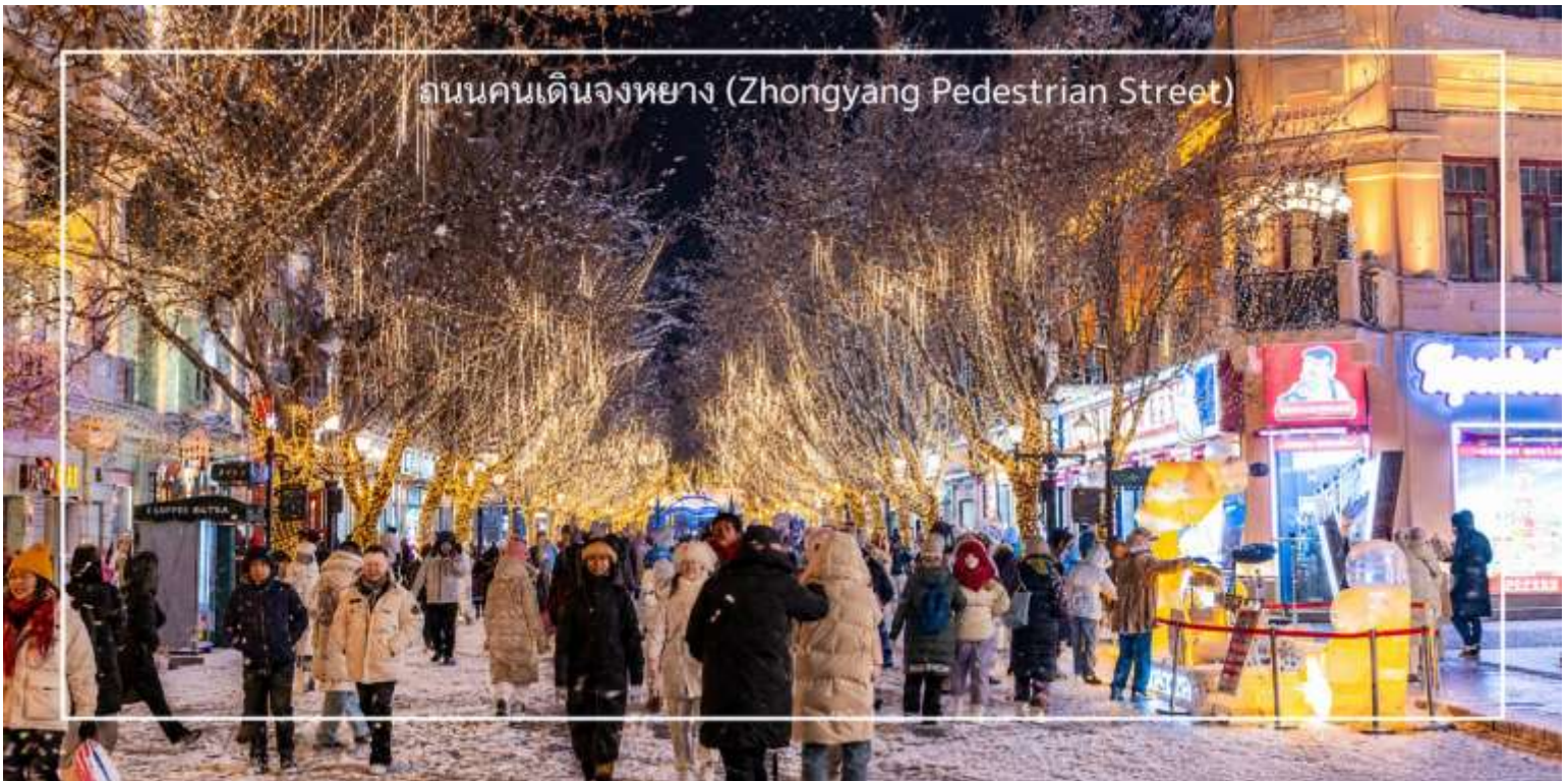
ถนนคนเดินจงหยาง (Zhongyang Pedestrian Street)

ให้ท่านอิสระช้อปปิ้ง ถนนคนเดินจงหยาง (Zhongyang Pedestrian Street) ถนนคนเดินชื่อดังของฮาร์บิน แหล่งรวมสินค้าท้องถิ่น ร้านค้า คาเฟ่ ร้านอาหาร เสื้อผ้า แฟชั่น รองเท้าและของฝากหลากหลายสไตล์ บรรยากาศยุโรปและจีนที่ผสมผสานได้อย่างลงตัว แวะชม Popmart เก็บคอลเลกชันใหม่ ๆ ของฟิกเกอร์สุดน่ารัก ที่สายสะสมของเล่นไม่ควรพลาด