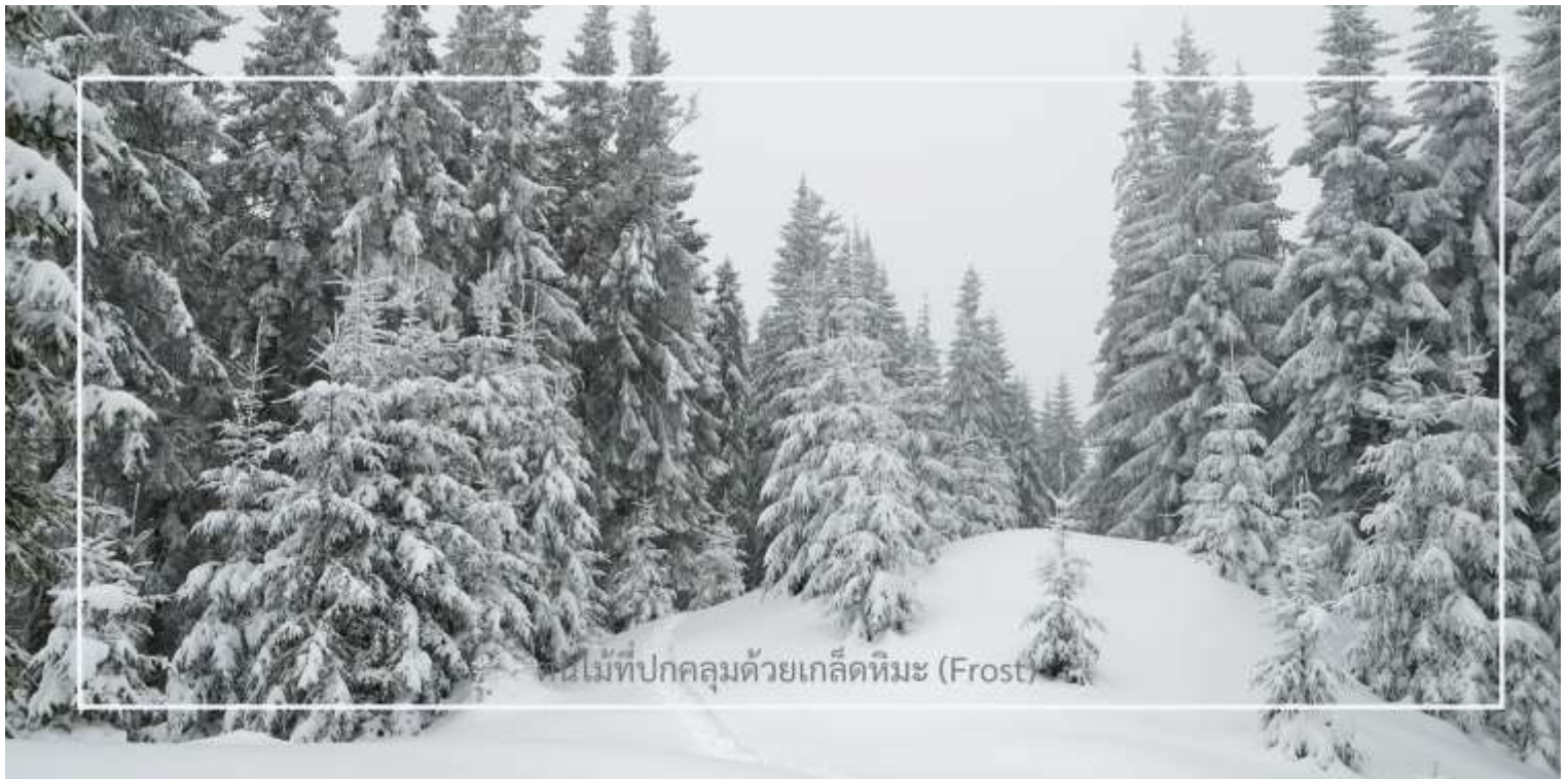
ต้นไม้ที่ปกคลุมด้วยเกล็ดหิมะ (Frost)