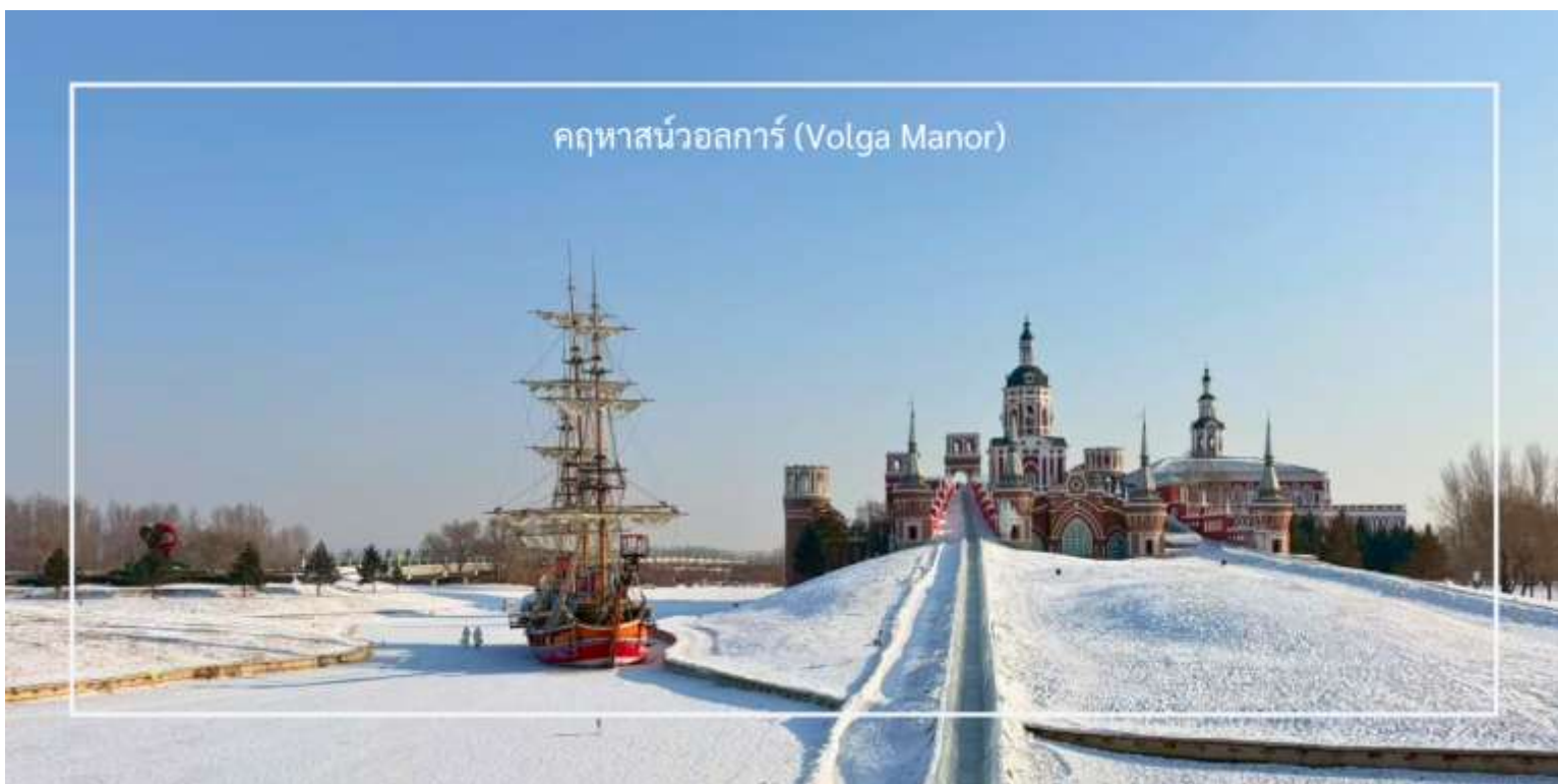
คฤหาสน์วอลการ์ (Volga Manor)

หลังอาหารพาท่านชม นำท่านดื่มด่ำกับบรรยากาศราวกับอยู่ในรัสเซีย ณ คฤหาสน์วอลการ์ (Volga Manor) เพลิดเพลินกับการเดินเล่นชมความงดงามของอาคารสไตล์ยุโรปโบราณที่ผสมผสานวัฒนธรรมรัสเซียและฮาร์บินได้อย่างลงตัว ไฮไลต์อยู่ที่โบสถ์จำลอง St. Nicholas Cathedral หนึ่งในสัญลักษณ์ประวัติศาสตร์ของฮาร์บิน ที่ถูกบูรณะขึ้นใหม่อย่างวิจิตรสมจริง รอบบริเวณยังรายล้อมด้วยอาคารไม้และปราสาทเล็กแบบรัสเซียมากมาย กว่า 30 หลัง ด้านในมีกิจกรรมที่น่าสนใจมากมาย ทั้ง ลานสไลด์น้ำแข็ง, เลื่อนหิมะ, ลานสเก็ตกลางแจ้ง ฯลฯ (รวมค่าเข้า ไม่รวมค่ากิจกรรมภายใน)