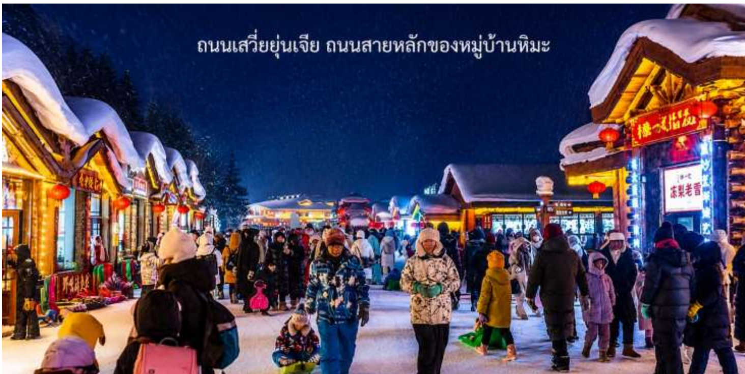
ถนนเสวี่ยย่นเจีย ถนนสายหลักของหมู่บ้านหิมะ

ข้อปึงสินค้าแชนด์เมด พร้อมถ่ายภาพเก็บความทรงจำในมุมสวย ๆ ของหมู่บ้าน