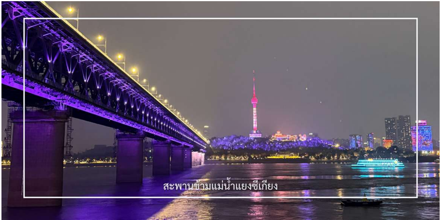
สะพานข้ามแม่น้ำแยงซีเกียง

จากนั้นนำท่านช้อปปิ้ง ณ ถนนสายสตรีทฟู้ดอู่เซียง แหล่งท่องเที่ยวชื่อดังของเมืองอู่ฮั่น และเป็นถนนอาหารยอดนิยมที่มีชื่อเสียงอย่างมาก สวรรค์ของนักชิมที่เต็ม เต็มไปด้วยร้านอาหารท้องถิ่นและสตรีทฟู้ดนานาชาติ แนะนำ บะหมี่แห้ง เล๋กัันเมี่ยน และ ต้มซุปรากบัว รสเลิศ อาหารพื้นเมืองเมืองอู่ฮั่นที่ต้องลอง นอกจากนี้บริเวณโดยรอบยังเป็นย่านช้อปปิ้งที่มีร้านค้าเรียงรายมากมาย ให้ท่านได้เพลิดเพลินกับการเลือกซื้อ เสื้อผ้า กระเป๋า รองเท้า ของฝาก และของที่ระลึก ตามอัธยาศัย