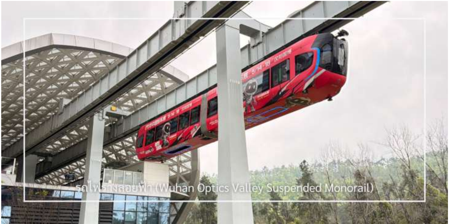
รถไฟรางลอยฟ้า (Wuhan Optics Valley Suspended Monorail)