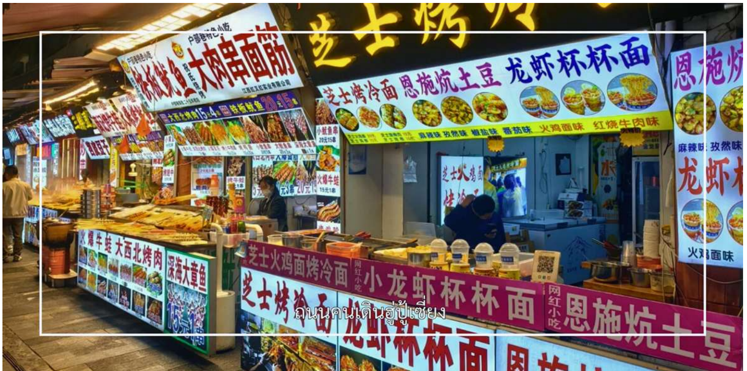
ถนนคนเดินอู่เซียง

จากนั้นนำท่านช้อปปิ้ง ณ ถนนสายสตรีทฟู้ดอู่เซียง แหล่งท่องเที่ยวชื่อดังของเมืองอู่ฮั่น และเป็นถนนอาหารยอดนิยมที่มีชื่อเสียงอย่างมาก สวรรค์ของนักชิมที่เต็ม เต็มไปด้วยร้านอาหารท้องถิ่นและสตรีทฟู้ดนานาชาติ แนะนำ บะหมี่แห้ง เล๋กัันเมี่ยน และ ต้มซุปรากบัว รสเลิศ อาหารพื้นเมืองเมืองอู่ฮั่นที่ต้องลอง นอกจากนี้บริเวณโดยรอบยังเป็นย่านช้อปปิ้งที่มีร้านค้าเรียงรายมากมาย ให้ท่านได้เพลิดเพลินกับการเลือกซื้อ เสื้อผ้า กระเป๋า รองเท้า ของฝาก และของที่ระลึก ตามอัธยาศัย