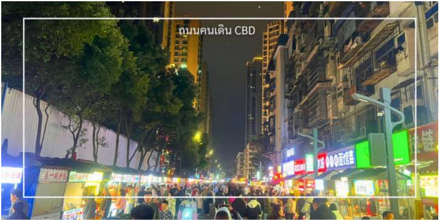
ถนนคนเดิน CBD

นำท่านช้อปปิ้ง ถนนคนเดินย่าน CBD แหล่งรวมความคึกคักของคนเมืองอู่ฮาง โดยเฉพาะช่วงเย็นถึงค่ำคืนที่เต็มไปด้วยแสงสี ร้านค้า และผู้คนที่ยออกมาเดินเล่นกันอย่างคึกคักสองข้างทางมีทั้งห้าง ร้านเสื้อผ้า รองเท้า คาเฟ่ และร้านอาหารให้เลือกเดินได้เพลิน ๆ จุดที่พลาดไม่ได้คือโซนสตรีทฟู้ด มีของกินให้เลือกมากมาย แนะนำหอยนางรมย่างราดซอสกระเทียมหอม ๆ รสชาติเข้มข้น อร่อยมาก ใครสายกินต้องลอง และยังมีสินค้าแฟชั่นราคาย่อมเยาให้เลือกซื้อแบบจุใจ