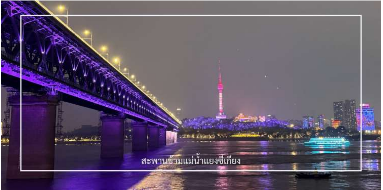
สะพานข้ามแม่น้ำแยงซีเกียง

นำท่านชม สะพานข้ามแม่น้ำแยงซีเกียงแห่งแรกของประเทศจีน (Wuhan Yangtze River Bridge) สะพานสำคัญที่เชื่อมระหว่างฝั่งฮั่นโหว่และอู่ชาง สร้างขึ้นในปี ค.ศ. 1957 และถือเป็นหนึ่งในสัญลักษณ์ของการพัฒนาโครงสร้างพื้นฐานของจีนในยุคใหม่ ตัวสะพานเป็นโครงสร้าง 2 ชั้น สำหรับการสัญจรของรถยนต์และรถไฟ บริเวณนี้ยังเป็นจุดชมวิวที่สามารถมองเห็นแม่น้ำแยงซีเกียงและทัศนียภาพของเมืองอู่ชางได้อย่างสวยงาม โดยเฉพาะในช่วงค่ำคืนที่แสงไฟของเมืองส่องสะท้อนกับสายน้ำ สร้างบรรยากาศที่น่าประทับใจ