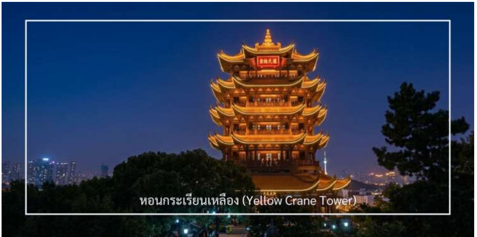
หอนกระเรียนเหลือง (Yellow Crane Tower)

นำท่านชมแสงสียามค่ำคืน หอนกระเรียนเหลือง (Yellow Crane Tower) หนึ่งในสถานที่สำคัญและเป็นสัญลักษณ์ของเมืองอู่ฮั่น เป็นหอคอยโบราณที่มีประวัติศาสตร์ยาวนานกว่า 1,700 ปี ตั้งอยู่ริมฝั่งแม่น้ำแยงซี โดดเด่นด้วยสถาปัตยกรรมจีนโบราณอันงดงามและสง่างาม หอแห่งนี้มีความสำคัญทั้งในด้านประวัติศาสตร์ วัฒนธรรม และวรรณกรรม โดยปรากฏอยู่ในบทกวีจีนโบราณหลายบท และถือเป็นหนึ่งในสี่หอคอยที่มีชื่อเสียงที่สุดของจีน