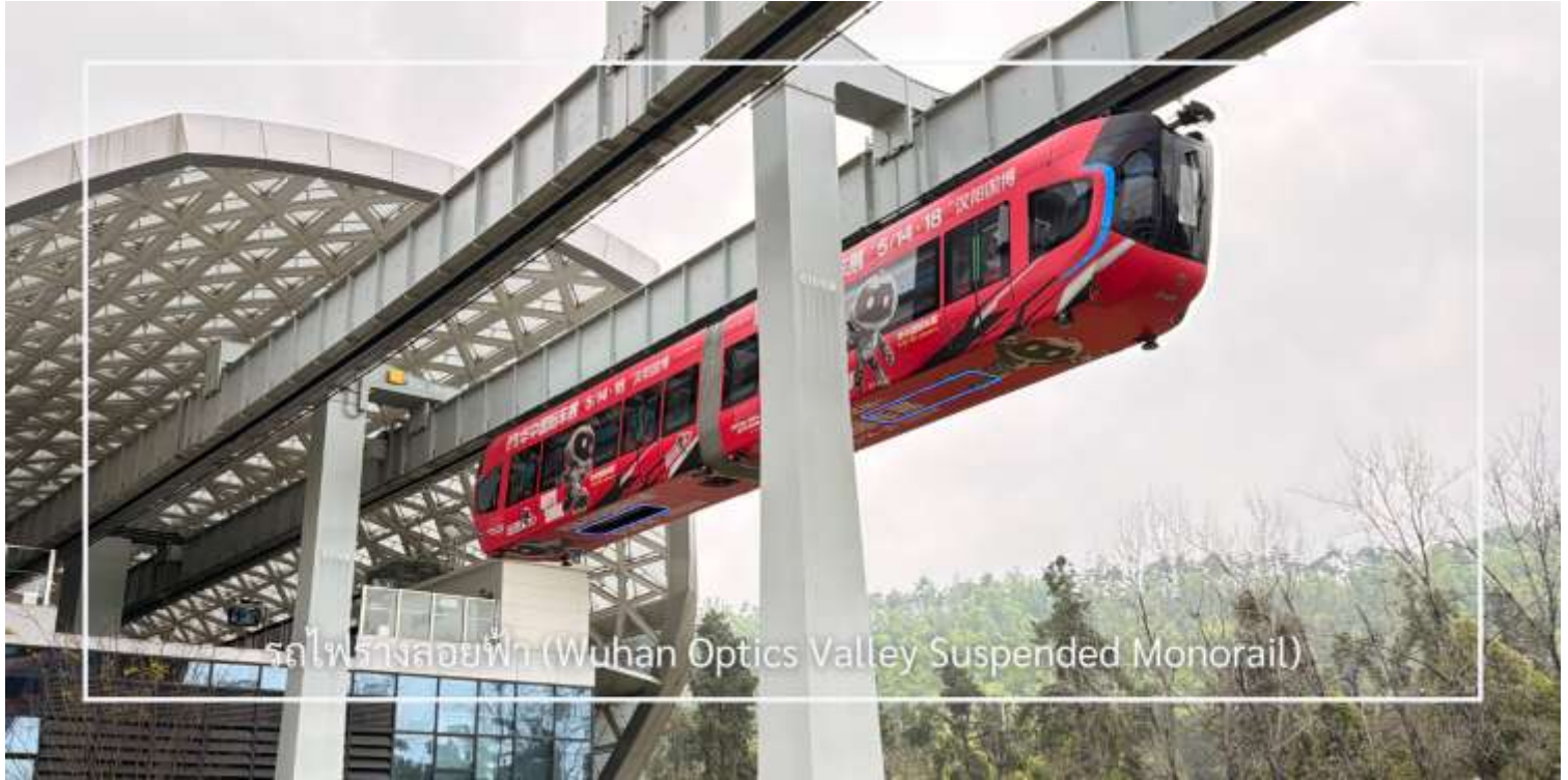
รถไฟรางลอยฟ้า (Wuhan Optics Valley Suspended Monorail)

นำท่านสู่ ห้าง Wushang Dream Plaza Mall แลนด์มาร์กช้อปปิ้งขนาดใหญ่ของเมืองอู่ฮั่น ที่รวมทุกไลฟ์สไตล์ไว้ในที่เดียว ภายในรวบรวมสินค้าแฟชั่น เครื่องประดับ ของฝาก และแบรนด์ชั้นนำมากมาย ให้ท่านได้เลือกชมและเลือกซื้อสินค้าอย่างเพลิดเพลิน พร้อมสิ่งอำนวยความสะดวกและโซนความบันเทิงครบครัน อาทิ สนามขี่ม้า สวนสนุกในร่ม ศูนย์เกม และโชว์รูมรถยนต์ และเทคโนโลยีต่าง ๆ เสมือนยกทั้งเมืองแห่งความสนุกและไลฟ์สไตล์มาไว้ภายในห้างเดียว ให้ท่านอิสระตามอัธยาศัย