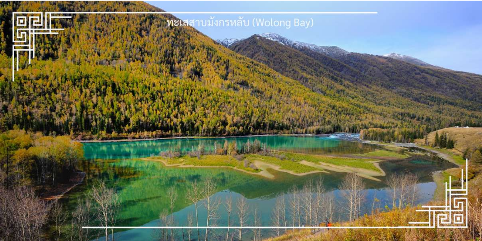
ทะเลสาบมังกรหลับ (Wolong Bay)

จากนั้นนำท่านชม ทะเลสาบเทวดา (Fairy Bay) จุดชมวิวยุคไฮไลท์ที่ตั้งอยู่ทางตอนใต้ของทะเลสาบคานาสือ ภายในเขตโดดเด่นด้วยผืนน้ำใสสะอาดอันเงาขุนเขาและผืนป่า สร้างบรรยากาศราวดินแดนในเทพนิยาย สถานที่แห่งนี้มีชื่อเรียกตามตำนานท้องถิ่นว่า “อ่าวของเหล่าเซียน” โดยเล่าขานกันว่าเป็นสถานที่ที่เหล่าเทพเซียนลงมาเล่นน้ำ จึงยิ่งเพิ่มเสน่ห์และความลึกลับให้กับทัศนียภาพอันงดงาม