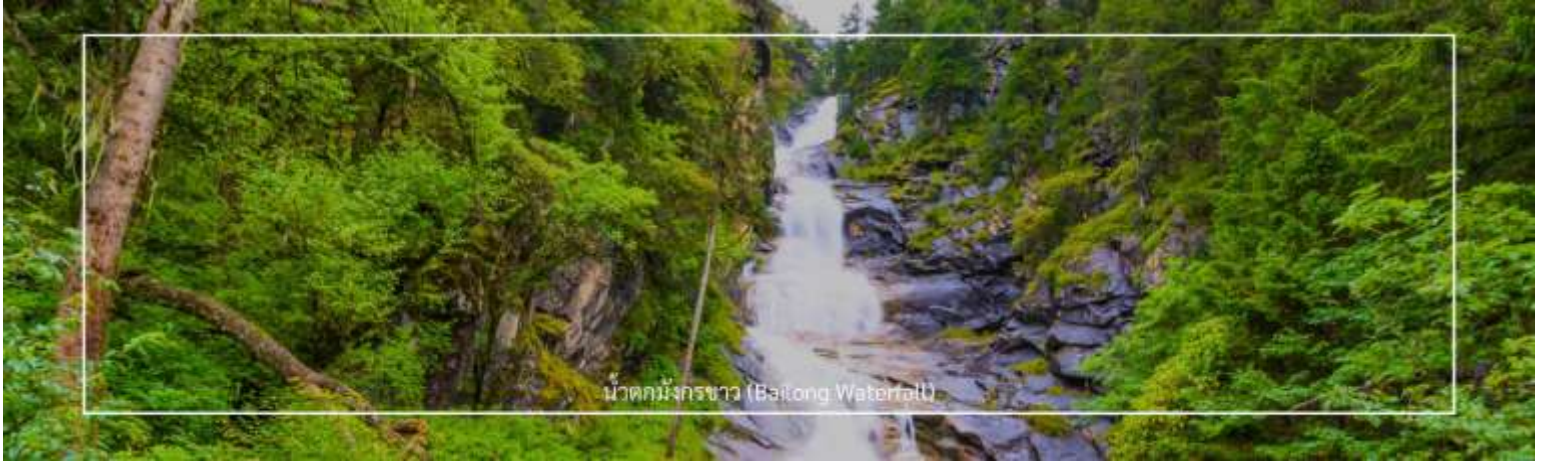
น้ำตกมังกรขาว (Bailong Waterfall)

สมควรแก่เวลานำท่านสู่ สะพานโบราณหนานเฉียว สะพานไม้โบราณในเมืองตูเจียงเยียน เป็นแหล่งท่องเที่ยวระดับ 5A ที่โดดเด่นด้วยสถาปัตยกรรมแบบราชวงศ์ชิงผสมทิเบต ไฮไลท์คือการประดับไฟหลากสีสันในช่วงกลางคืน ส่องสะท้อนกับแม่น้ำหมินเจียงจนเกิดภาพ "น้ำตาสีฟ้า" (Blue Tears) ที่สวยงาม