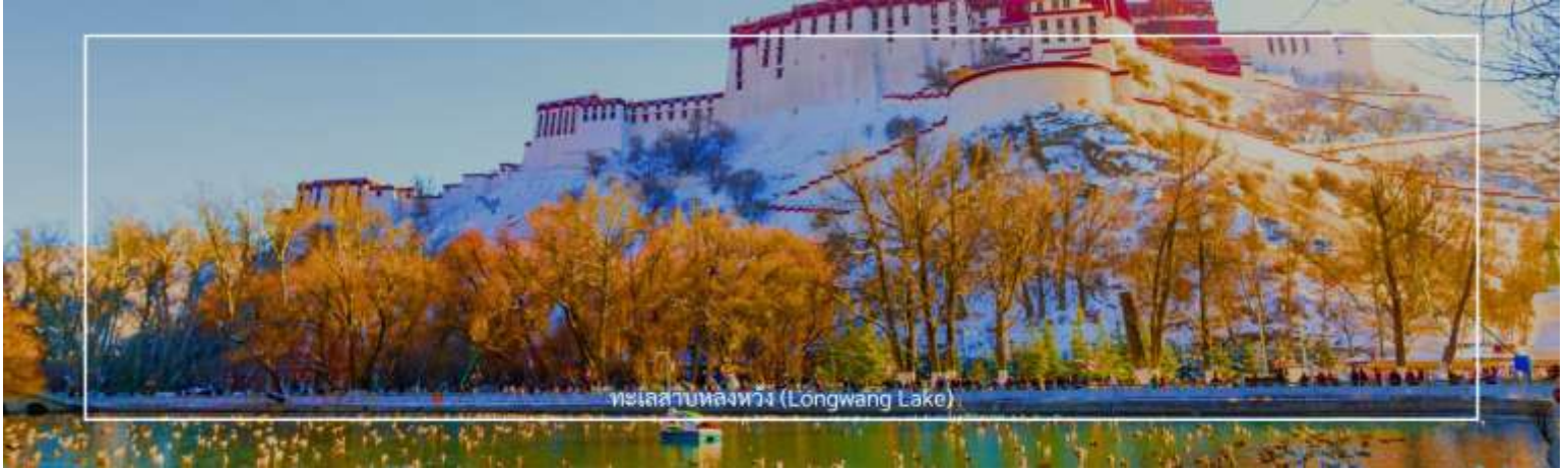
ทะเลสาบหลงหวาง (Longwang Lake)