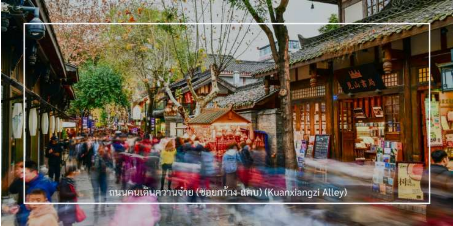
ถนนคนเดินคานจ้าย (ชื่อยกวาง-แคบ) (Kuanxiangzi Alley)

จากนั้นนำท่านเดินทาง เที่ยวชม วัดต้าสือ (Daci Temple) คือวัดพุทธนิกายมหายานที่มีชื่อเสียงโด่งดังและเก่าแก่ที่สุดแห่งหนึ่งในภูมิภาคตะวันตกเฉียงใต้ของจีน มีประวัติศาสตร์อันยาวนานกว่า 1,600 ปี วัดต้าสือ มีสถาปัตยกรรมจีนแบบ