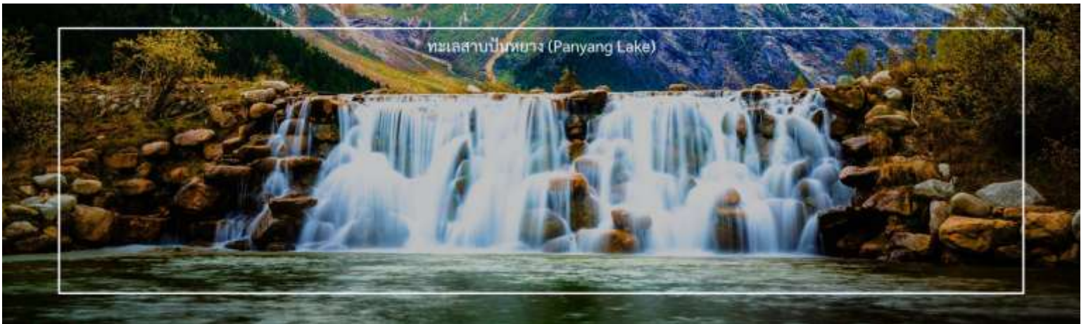
ทะเลสาบปันหยาง (Panyang Lake)

เป็นอีกหนึ่งจุดท่องเที่ยวที่น่าสนใจในอุทยานปีนังโกว ทะเลสาบปันหยางมีบรรยากาศที่เงียบสงบและเป็นธรรมชาติเหมาะสำหรับการพักผ่อนและใช้เวลาอยู่กับธรรมชาติ ตั้งอยู่ที่ความสูง 3,676 เมตรเหนือระดับน้ำทะเล มีขนาดพื้นที่ครอบคลุมถึง 450,000 ตารางกิโลเมตร ลึก 2 – 6 เมตร เป็นทะเลสาบอัลไพน์ที่ขึ้นชื่อเรื่องความใสของน้ำและมีปลาอาศัยอยู่จำนวนมาก ล้อมรอบด้วยภูเขา ป่า ดอกไม้ และใบไม้ที่เปลี่ยนสีตามฤดูกาล มีความอุดมสมบูรณ์จนกลายเป็นสถานที่ที่เหมาะสมสำหรับการศึกษาด้านชีววิทยาและการถ่ายภาพธรรมชาติ โดยชื่อปันหยางนั้นมาจากชื่อของ แพะภูเขาชนิดหนึ่ง que พบเห็นได้บ่อยในบริเวณนี้