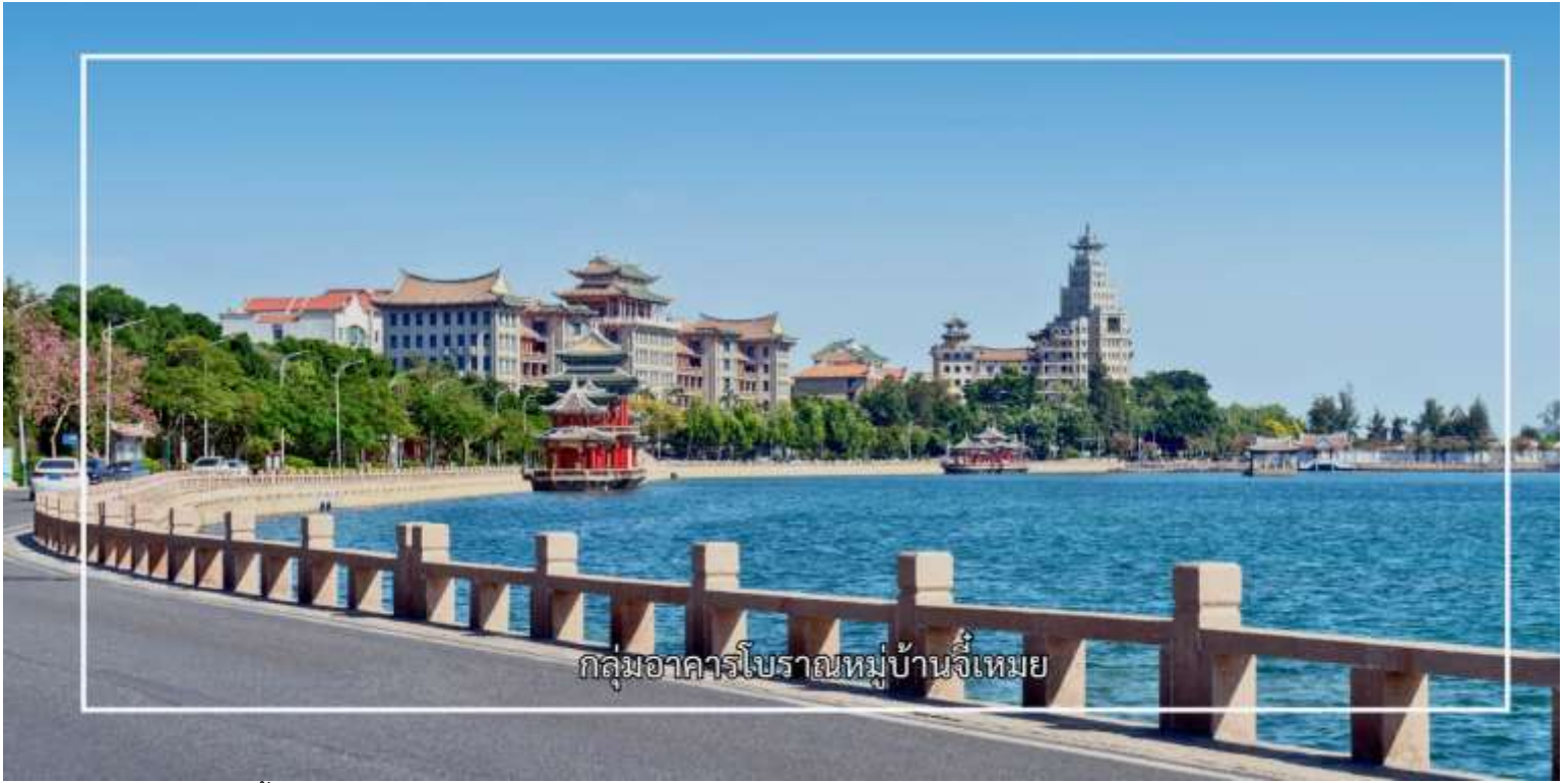
กลุ่มอาคารโบราณหมู่บ้านจีเหมย

จากนั้นนำท่านสู่ สระเรือมังกร (Dragon Boat Pond) เป็นแหล่งท่องเที่ยวทางวัฒนธรรมและภูมิทัศน์ที่มีชื่อเสียงของเมือง สระน้ำแห่งนี้สร้างขึ้นโดยมีจุดประสงค์เพื่อใช้จัดการแข่งขันเรือมังกร ซึ่งเป็นประเพณีสำคัญที่สะท้อนรากเหง้าทางวัฒนธรรมของชาวจีน โดยเฉพาะในช่วงเทศกาลตวนอู๋ พื้นที่โดยรอบสระได้รับการออกแบบอย่างงดงาม รายล้อมด้วยอาคารสไตล์จีนดั้งเดิม สะพาน ทางเดิน และสวนสาธารณะ ทำให้เกิดบรรยากาศที่ผสมผสานระหว่างความสงบร่มรื่นและกลิ่นอายทางประวัติศาสตร์ สระเรือมังกรจีเหมยจึงเหมาะแก่การเดินชมทัศนียภาพ ถ่ายภาพ และเรียนรู้เรื่องราวทางวัฒนธรรมของเมืองเซี่ยเหมินอย่างใกล้ชิด