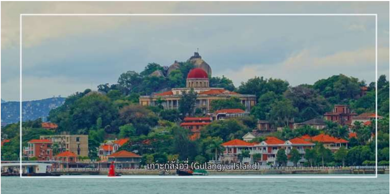
เกาะกู่ลิ่งอวี่ (Gulangyu Island)

สัมผัสกลิ่นไอความคลาสสิกกับ กลุ่มอาคาร Wanguo บนเกาะกู่ลิ่งอวี่ ซึ่งเป็นกลุ่มสถาปัตยกรรมที่สะท้อนอิทธิพลตะวันตก จากหลายประเทศในอดีต อาคารแต่ละหลังมีรูปแบบแตกต่างกัน ทั้งสไตล์ยุโรปคลาสสิก โคลเนี่ยล และนีโอคลาสสิก จนได้รับสมญานามว่า “พิพิธภัณฑ์สถาปัตยกรรมนานาชาติ” และเดินเล่น ถนนการค้า Longtou เป็นถนนสายอาหารและ แหล่งช้อปปิ้งยอดนิยมบนเกาะกู่ลิ่งอวี่ (Gulangyu) ที่คึกคักและเต็มไปด้วยสีสัน พร้อมเพลิดเพลินกับบรรยากาศการเดิน เล่นบนถนนสายหลักที่สะท้อนวิถีชีวิตและเสน่ห์ของกู่ลิ่งอวี่ จากนั้นนำท่านแวะถ่ายรูปเช็คอินบริเวณ หาดทรายหลังท่าเรือ เพลิดเพลินกับบรรยากาศริมทะเลและทัศนียภาพอันสวยงาม เหมาะแก่การเก็บภาพความประทับใจเป็นที่ระลึก