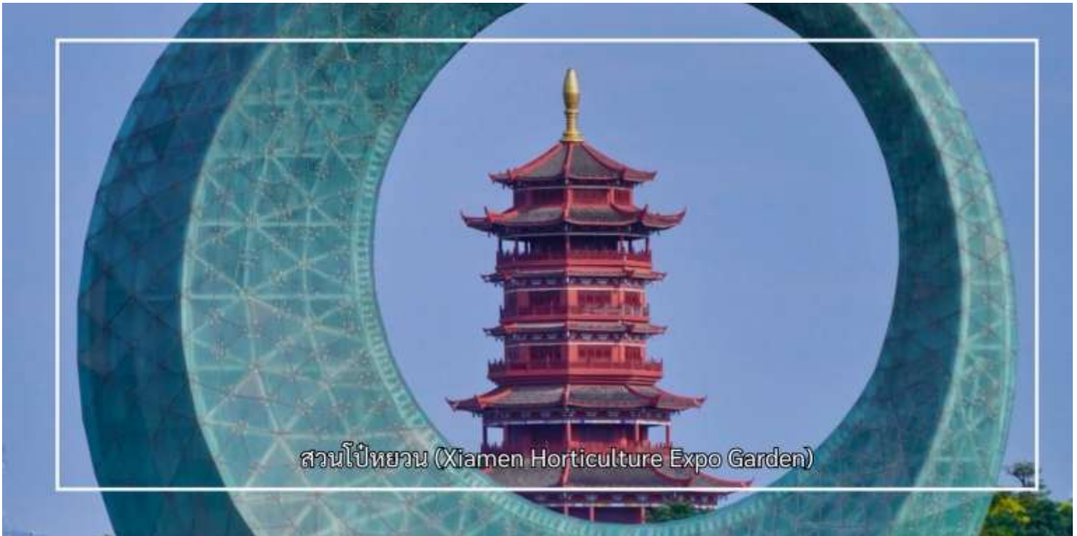
สวนโป๋หยวน (Xiamen Horticulture Expo Garden)

จากนั้นชม หอชมวิวไข่มุกทะเล (Sea Pearl Observation Tower) เป็นจุดชมวิวที่โดดเด่นและเป็นสัญลักษณ์สำคัญของเมือง ด้วยความสูงประมาณ 195 เมตร หอชมวิวแห่งนี้เปิดมุมมองทัศนียภาพแบบ 360 องศา ให้ผู้มาเยือนได้ชมความงดงามของเมืองเซี่ยเหมิน ชายฝั่งทะเล และภูมิทัศน์โดยรอบอย่างเต็มตา และเก็บภาพความประทับใจของเมืองท่าที่มีเสน่ห์แห่งนี้ จากนั้นเพลิดเพลินกับประสบการณ์ความบันเทิงที่ โรงภาพยนตร์โกลบอล ซึ่งนำเสนอภาพยนตร์และสื่อมัลติมีเดียทันสมัย ถ่ายทอดเรื่องราวและวัฒนธรรมของเมืองในรูปแบบที่น่าสนใจ ช่วยเติมเต็มการท่องเที่ยวให้ทั้งได้ชมวิวพักผ่อน และเรียนรู้ไปพร้อมกัน