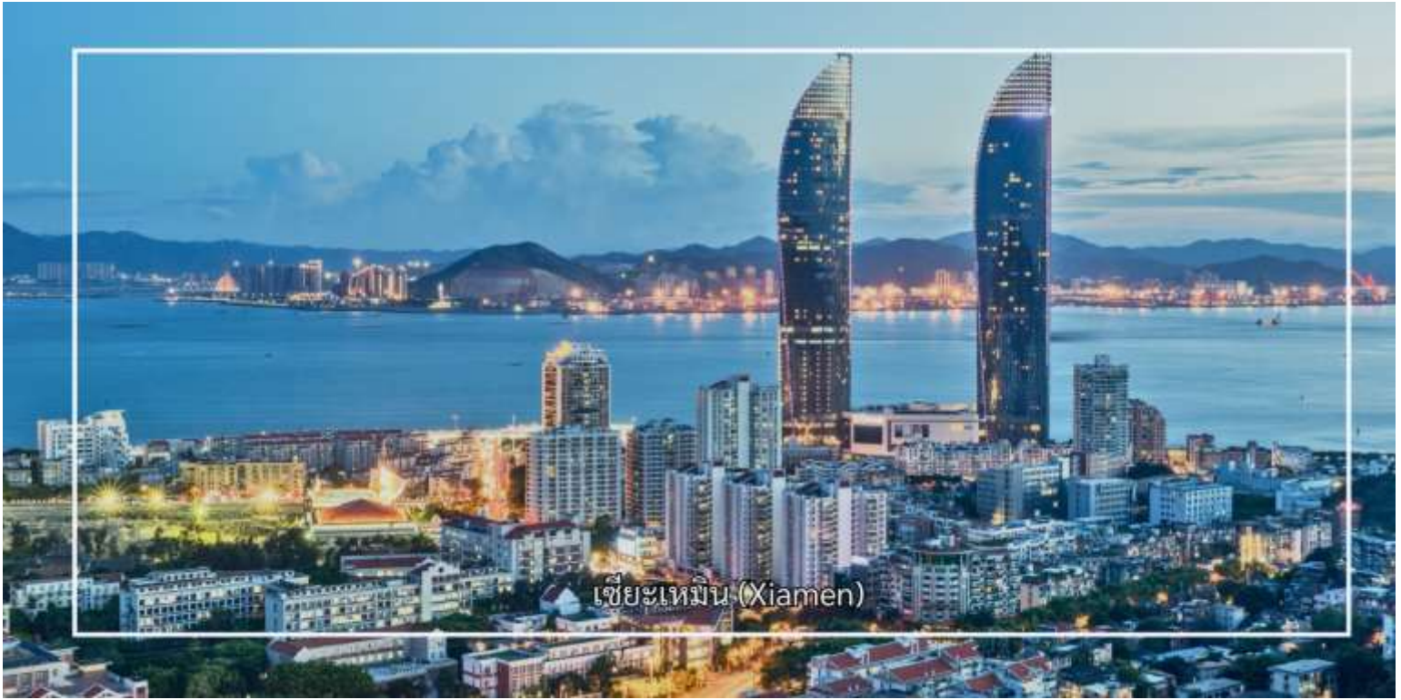
เซี่ยเหมิน (Xiamen)

นำท่านสู่ กลุ่มอาคารโบราณหมู่บ้านจีเหมย แหล่งท่องเที่ยวทางวัฒนธรรมที่สำคัญและสะท้อนเอกลักษณ์ทางสถาปัตยกรรมของชาวจีนโพ้นทะเลอย่างโดดเด่น อาคารส่วนใหญ่สร้างขึ้นในช่วงต้นศตวรรษที่ 20 โดยเงินเจียเกิง นักธุรกิจและนักการศึกษาผู้มีชื่อเสียง ซึ่งมีบทบาทสำคัญในการพัฒนาพื้นที่จีเหมยให้เป็นศูนย์กลางด้านการศึกษาและวัฒนธรรม สถาปัตยกรรมของหมู่บ้านจีเหมยมีลักษณะเฉพาะ เรียกว่า “สไตล์จีเหมย” ซึ่งเป็นการผสมผสานระหว่างศิลปะจีนดั้งเดิมกับอิทธิพลตะวันตก หลังคาทรงจีน ผนังอิฐสีอ่อน ชุ่มประตู และรายละเอียดการตกแต่งที่ประณีต สะท้อนถึงความงามและคุณค่าทางประวัติศาสตร์อย่างชัดเจน พื้นที่ภายในประกอบด้วยอาคารเรียน วัด ศาลา และบ้านพักที่จัดวางอย่างเป็นระเบียบ สอดคล้องกับภูมิทัศน์โดยรอบ