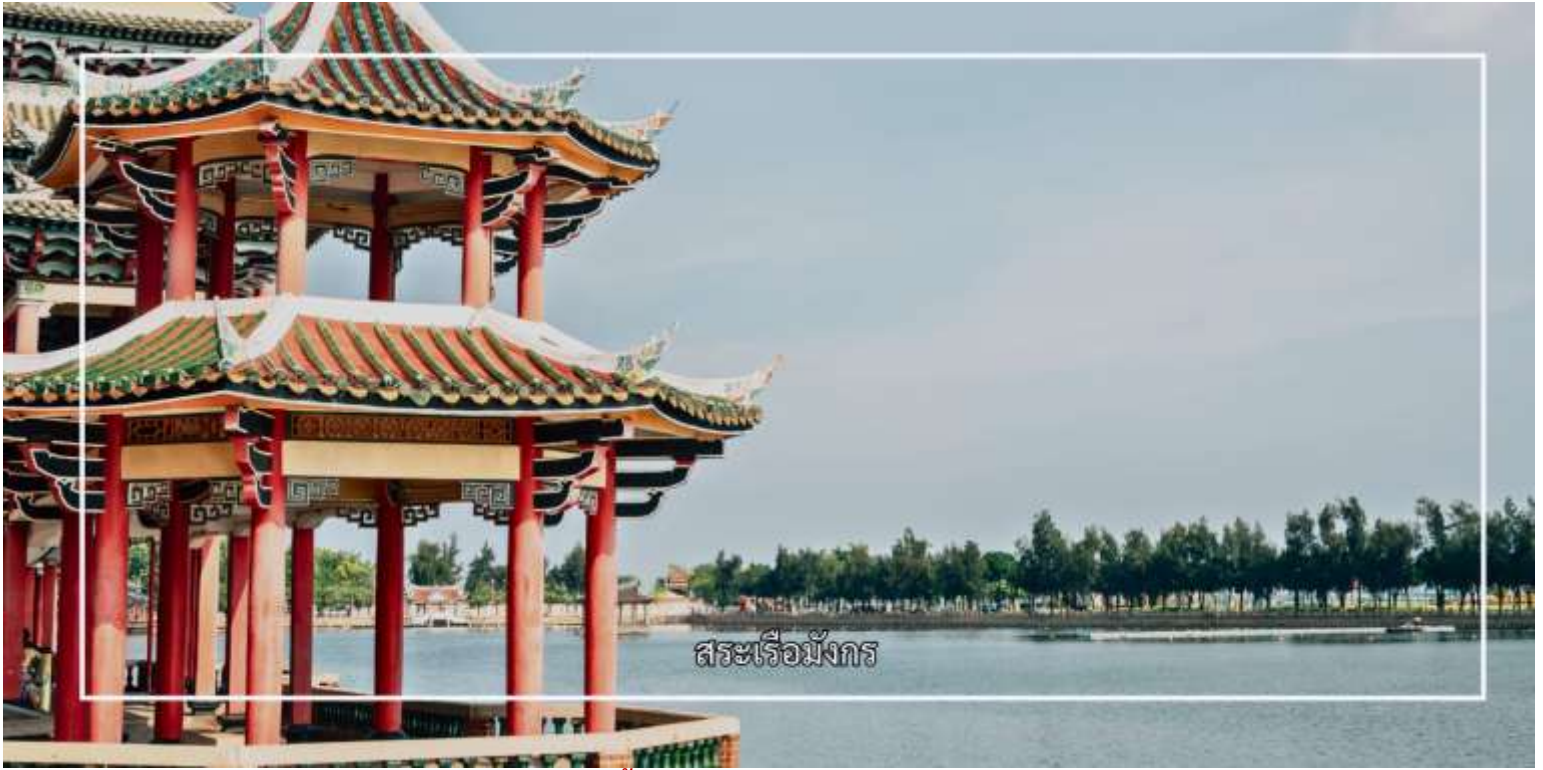
สระเรือมังกร

ค่ำ รับประทานอาหารค่ำ ณ ภัตตาคาร (มื้อที่ 1) จากนั้นเดินทางเข้าสู่โรงแรมที่พัก Xiamen Liyi Hotel ระดับ 4 ดาวหรือเทียบเท่ามาตรฐานจีน (โรงแรมที่ระบุในรายการทัวร์ เป็นเพียงโรงแรมที่นำเสนอเบื้องต้นเท่านั้น ซึ่งอาจมีการเปลี่ยนแปลง แต่โรงแรมที่เข้าพักจะเป็นโรงแรมระดับเทียบเท่ากัน)