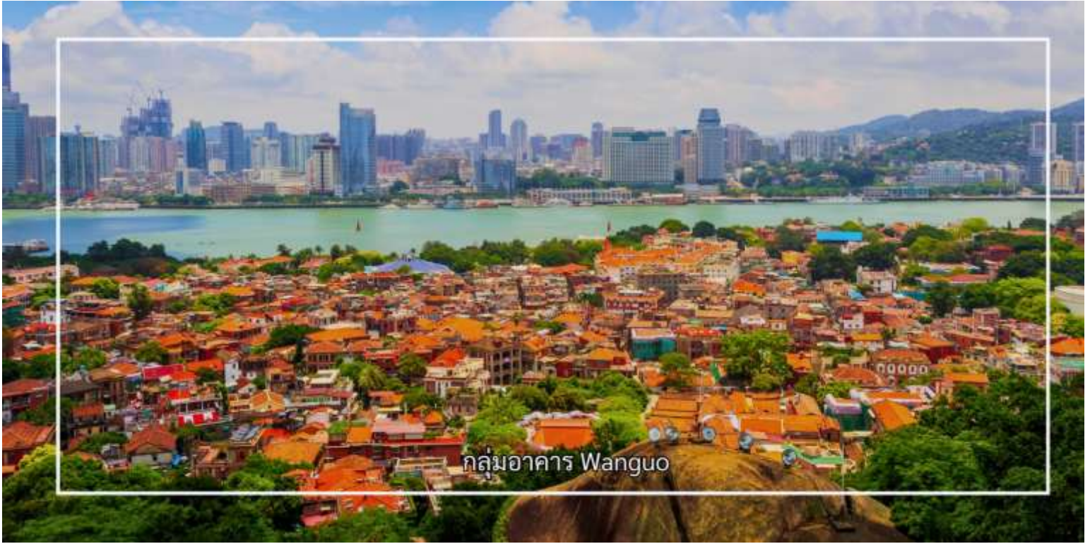
กลุ่มอาคาร Wanguo

Tel:085-4063944 letagotravel@gmail.com Line ID: @letagotravel https://www.letago.com