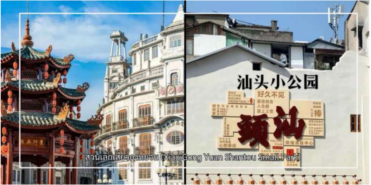
สวนเล็กเสี่ยวกงหยวน (Xiao Gong Yuan Shantou Small Park)

จากนั้นนำท่านสักการะ พระราชวังแม่เต๋า หรือที่ชาวบ้านและนักเดินทางรู้จักกันในนาม ศาลเจ้าแม่ทับทิมไต้หวันมา (Hai Tan Ma Temple) เป็นศาสนสถานสำคัญที่สะท้อนถึงความศรัทธาอันยาวนานของชุมชนชาวจีนโพ้นทะเล ศาลเจ้าแห่งนี้อุทิศแด่เจ้าแม่ทับทิม เทพีผู้คุ้มครองการเดินทางเรือ การค้า และความปลอดภัยในการเดินทาง โดยเฉพาะในหมู่พ่อค้าและชาวประมง ด้วยสถาปัตยกรรมจีนดั้งเดิมอันงดงาม รายละเอียดการตกแต่งที่ประณีต และบรรยากาศอันสงบศักดิ์สิทธิ์ วัดต้าเฟิง (Da Feng Gong Temple) ศาสนสถานศักดิ์สิทธิ์และเป็นที่เคารพนับถืออย่างสูงของชาวเมืองและผู้มีจิตศรัทธา วัดแห่งนี้มีความสำคัญทางประวัติศาสตร์และวัฒนธรรมมาอย่างยาวนาน ภายในวัดประดิษฐานสิ่งศักดิ์สิทธิ์ที่ผู้คนให้ความเคารพนับถือ พร้อมด้วยสถาปัตยกรรมจีนดั้งเดิมที่งดงาม