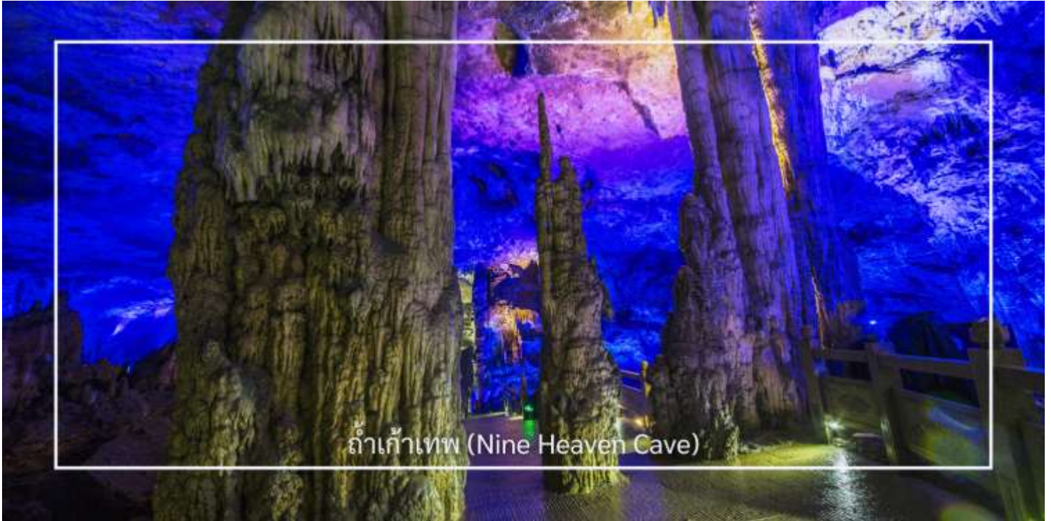
ถ้ำเก้าเทวดา (Nine Heaven Cave)