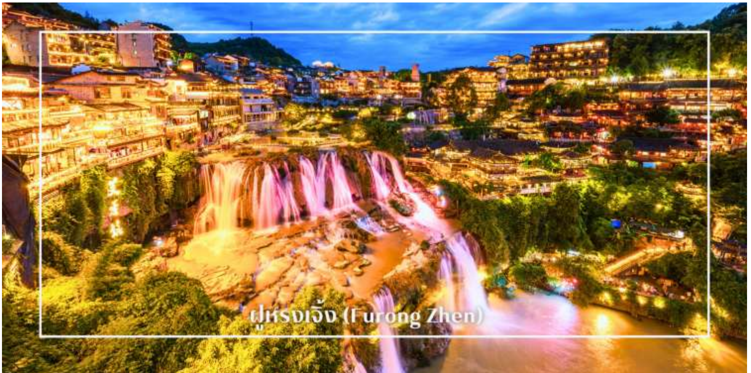
ฝูรงจิ้ง (Furong Zhen)

นำท่านเยี่ยมชม หมู่บ้านโบราณขู่จู่ไจ้ (Kuzhuzhai Ancient Village) หมู่บ้านโบราณที่ยังคงเสน่ห์และวิถีชีวิตดั้งเดิมของชาวพื้นเมืองไว้ได้อย่างสมบูรณ์ บ้านเรือนไม้โบราณเรียงรายตามแนวถนนหิน บรรยากาศเงียบสงบ โอบล้อมด้วยธรรมชาติอันงดงาม และนำท่านล่องเรือชมความงามของ Maoyan River สายน้ำใสที่ไหลคดเคี้ยวผ่านหุบเขาและผืนป่า