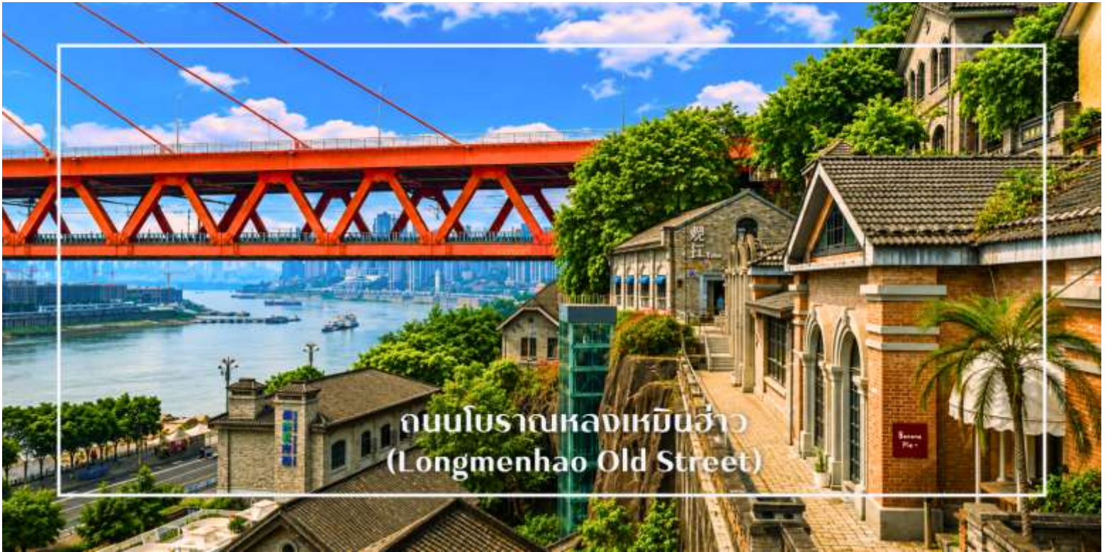
ถนนโบราณหลงเหมินฮ่าว (Longmenhao Old Street)