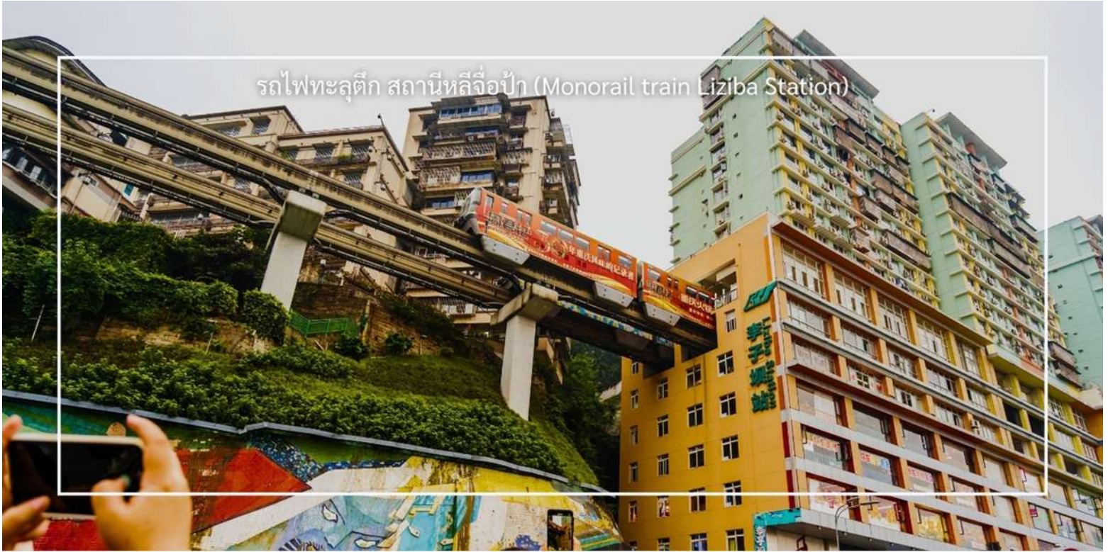
รถไฟทะเลตึก สถานีหลี่จื่อปา (Monorail train Liziba Station)