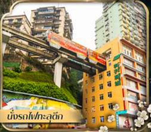
นั่งรถไฟทะเลตุ๊ก