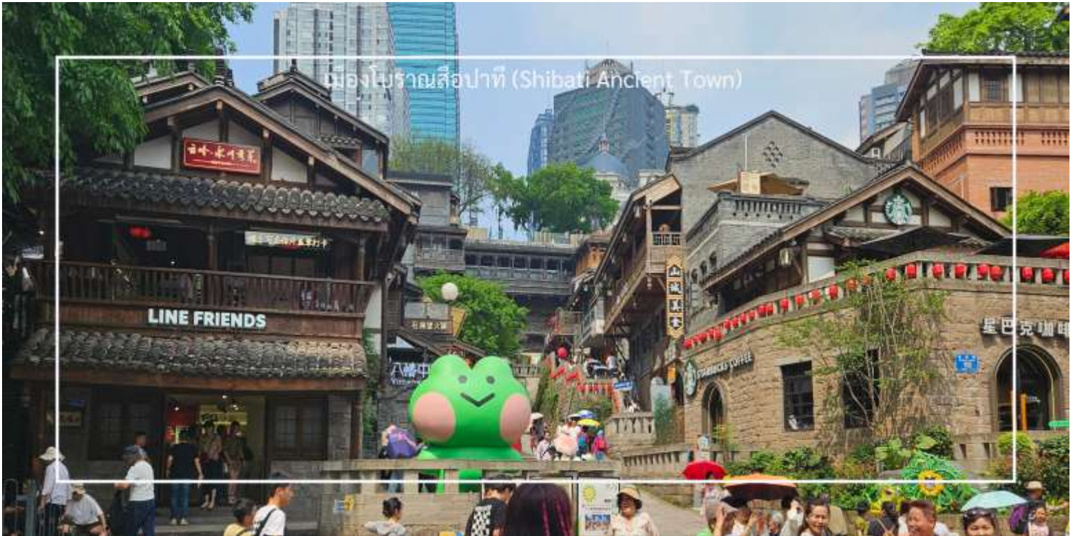
เมืองโบราณสี่ปาตี (Shibati Ancient Town)

Tel: 085-4063944 letagotravel@gmail.com Line ID: @letagotravel https://www.letago.com