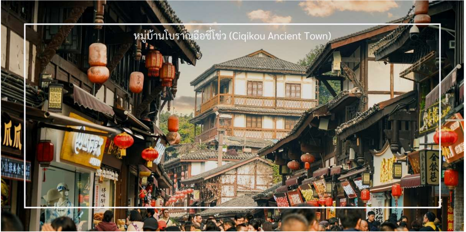
หมู่บ้านโบราณฉือซีโข่ว (Ciqikou Ancient Town)

โปรแกรม ทัวร์ฉงชิ่ง อุโมงค์ อุทยานหลุมฟ้า อุทยานเขานางฟ้า นั่งรถไฟทะเลตึก กระเช้าข้ามแม่น้ำ บันไดเลื่อน Huangguan (3U) 5วัน 4คืน - รหัสทัวร์ CH0726411