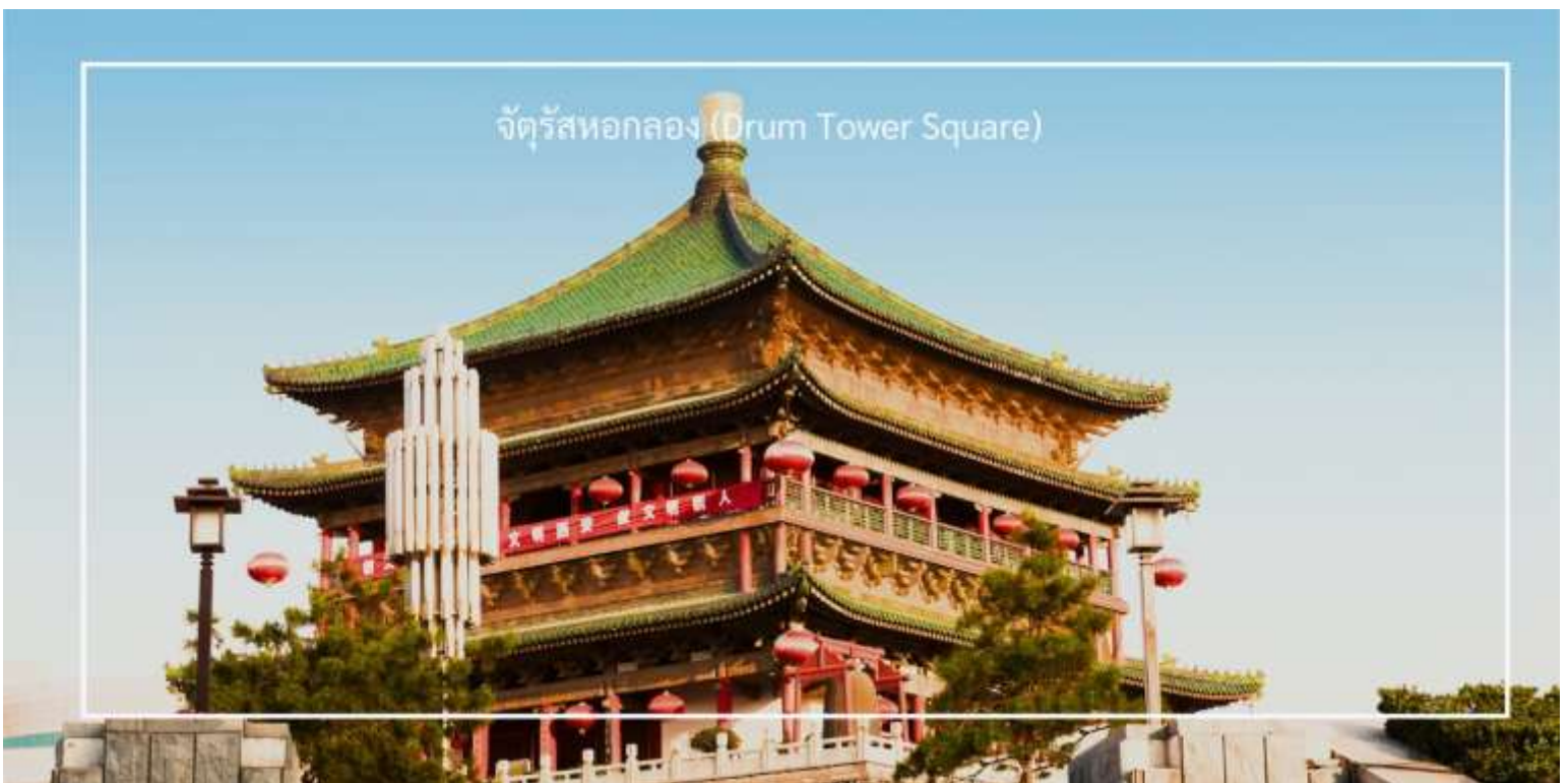
จัตุรัสทอกลอง (Drum Tower Square)

ผ่านชม จัตุรัสทอกลอง (Drum Tower Square) อีกหนึ่งจุดแลนด์มาร์คใจกลางเมืองซีอาน ซึ่งตั้งอยู่ใกล้กับหอรระซัง โดยทอกลองนี้สร้างขึ้นในสมัยราชวงศ์หมิง ใช้สำหรับตีบอกเวลาในอดีต โดดเด่นด้วยสถาปัตยกรรมจีนเก่าแก่ที่งดงามและดูยิ่งใหญ่