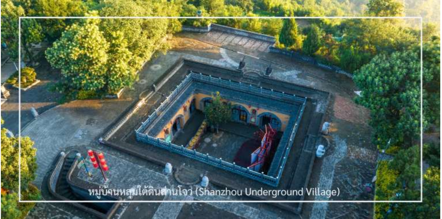
หมู่บ้านหลุมใต้ดินसानโจว (Shanzhou Underground Village)

ความอบอุ่นในฤดูหนาวและเย็นสบายในฤดูร้อน หมู่บ้านหลุมใต้ดินแห่งนี้สะท้อนวิถีชีวิตเรียบง่ายของชาวบ้านที่สืบทอดต่อกันมาหลายชั่วอายุคน ปัจจุบันได้รับการอนุรักษ์และพัฒนาเป็นแหล่งท่องเที่ยวเชิงวัฒนธรรมที่น่าสนใจ