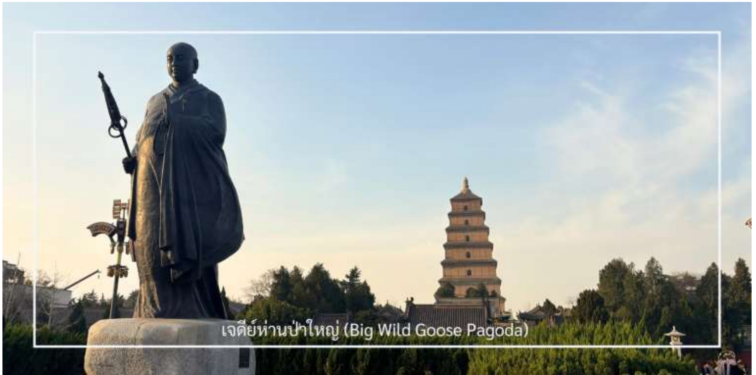
เจดีย์ห่านป่าใหญ่ (Big Wild Goose Pagoda)

นำท่านเดินทางสู่ เจดีย์ห่านป่าใหญ่ (Big Wild Goose Pagoda) ซึ่งตั้งอยู่ภายในบริเวณ วัดต้าซือเอิน (Da Ci'en Temple) สถานที่สำคัญทางพุทธศาสนาและประวัติศาสตร์ของจีน สร้างขึ้นในปี ค.ศ. 652 สมัยราชวงศ์ถัง เพื่อเก็บรักษาพระไตรปิฎกและพระธรรมคัมภีร์ที่ พระถังซำจั๋ง อัญเชิญกลับจากชมพูทวีป เจดีย์มีลักษณะทรงสี่เหลี่ยมแบบชั้นบันได สร้างด้วยอิฐเผา สะท้อนศิลปะจีนที่ผสมผสานอิทธิพลจากอินเดีย เดิมสูง 5 ชั้น ต่อมาได้รับการบูรณะจนมีความสูง 7 ชั้น (ประมาณ 64 เมตร) เป็นแบบอย่างของสถาปัตยกรรมพุทธศิลป์ยุคราชวงศ์ถังที่เรียบง่ายแต่ทรงพลัง ปัจจุบันเจดีย์แห่งนี้ถือเป็นสัญลักษณ์ทางวัฒนธรรมของเมืองซีอานและสถานที่ท่องเที่ยวยอดนิยมที่ควรมาเยือน