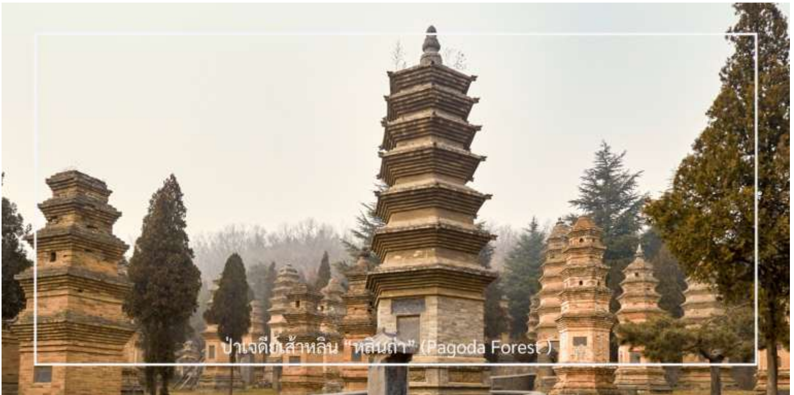
ปางเจดีย์สำหรัลลิน "หลินถ้ำ" (Pagoda Forest)

เที่ยง รับประทานอาหารเที่ยง ณ ภัตตาคาร บริการบุฟเฟต์ สุกี้ + BBQ ปิ้งย่าง พร้อมเครื่องดื่มไม่อั้น (มื้อที่ 5)