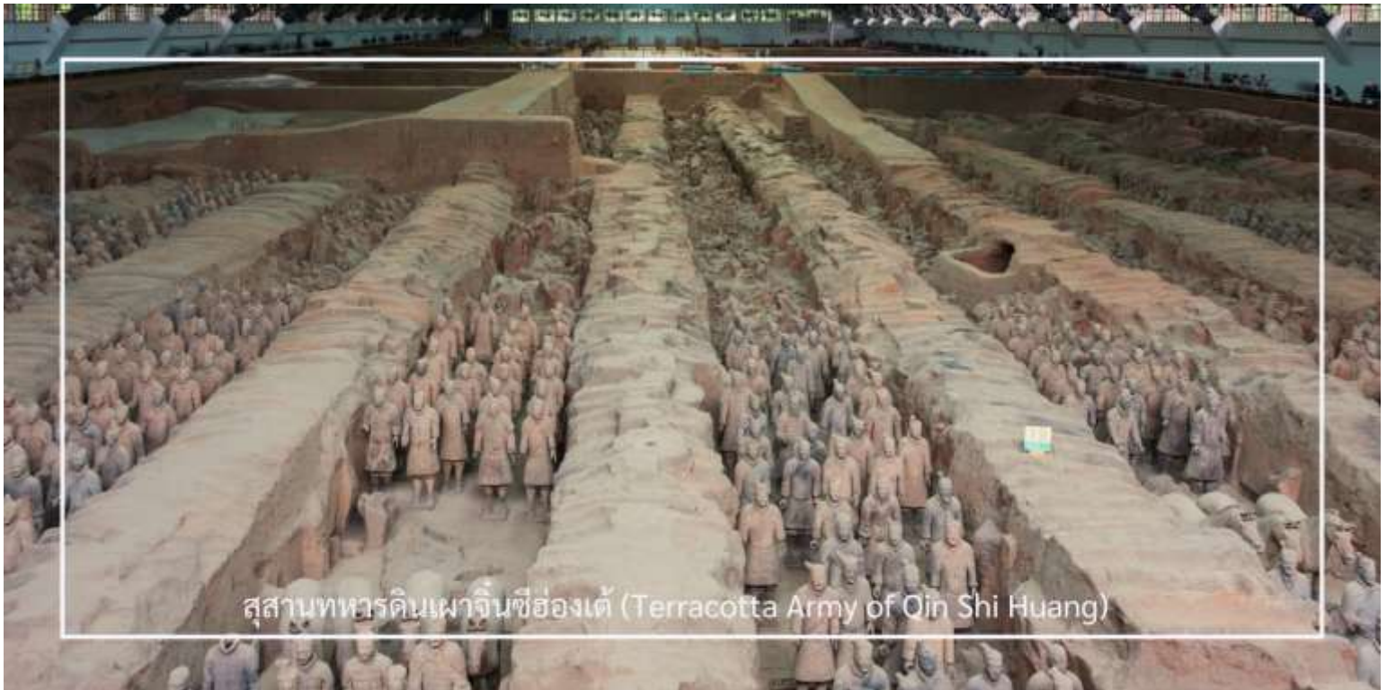
สุสานทหารดินเผาจีนซีฮ่องเต้ (Terracotta Army of Qin Shi Huang)

บริเวณใกล้เคียงเป็นที่ตั้งของ พิพิธภัณฑ์ ซึ่งจัดแสดงกองทัพทหารดินเผาและโบราณวัตถุต่างๆ รวมถึงข้อมูลประวัติศาสตร์เกี่ยวกับจักรพรรดิฉินซีและยุคราชวงศ์ฉิน ภายในแบ่งโซนจัดแสดงอย่างเป็นระบบ นำเสนอเรื่องราวการค้นพบ กระบวนการขุดค้น และการฟื้นฟูงานศิลปะโบราณ ท่านจะได้ชมทหารดินเผาที่ยังอยู่ในสภาพสมบูรณ์ รวมถึงรถศึกและม้าโบราณอย่างใกล้ชิด