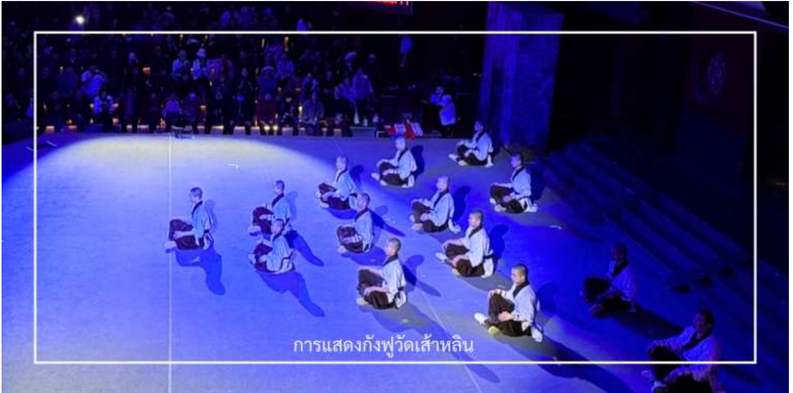
การแสดงกั๋งฟูวัดเส้าหลิน

นำท่านเดินทางสู่ ป่าเจดีย์เส้าหลิน “หลินถ่า” (Pagoda Forest ) สถานที่ศักดิ์สิทธิ์อันเจียบสงบท่ามกลางธรรมชาติ บริเวณเชิงเขาชางซาน ใกล้กับวัดเส้าหลิน ป่าเจดีย์แห่งนี้เป็นที่สำหรับบรรจุอัฐิของพระอาจารย์และพระภิกษุผู้ทรงคุณค่าแห่งวัดเส้าหลิน ซึ่งรวมถึงอดีตเจ้าอาวาสผู้มีบทบาทสำคัญในสายธรรมและวิทยายุทธ ภายในบริเวณเต็มไปด้วยเจดีย์หินจำนวนมากกว่า 240 องค์ ซึ่งบางองค์มีความสูงถึง 15 เมตร เจดีย์แต่ละองค์มีขนาดและรูปทรงแตกต่างกันไปตามยุคสมัย เช่น ทรงกลม ทรงสี่เหลี่ยม และทรงหกเหลี่ยม อีกทั้งยังประดับด้วยลวดลายแกะสลักอย่างวิจิตรงดงาม บางองค์มีจารึกที่บอกเล่าชีวประวัติของพระภิกษุผู้ได้รับการบูชาขึ้น ๆ