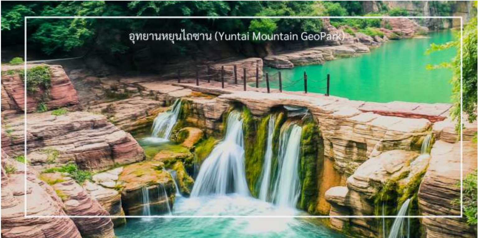
อุทยานหยุนไทซาน (Yuntai Mountain GeoPark)

เดินทางสู่ เมืองเต็งเฟิง ใช้เวลาเดินทางประมาณ 2 ชั่วโมง