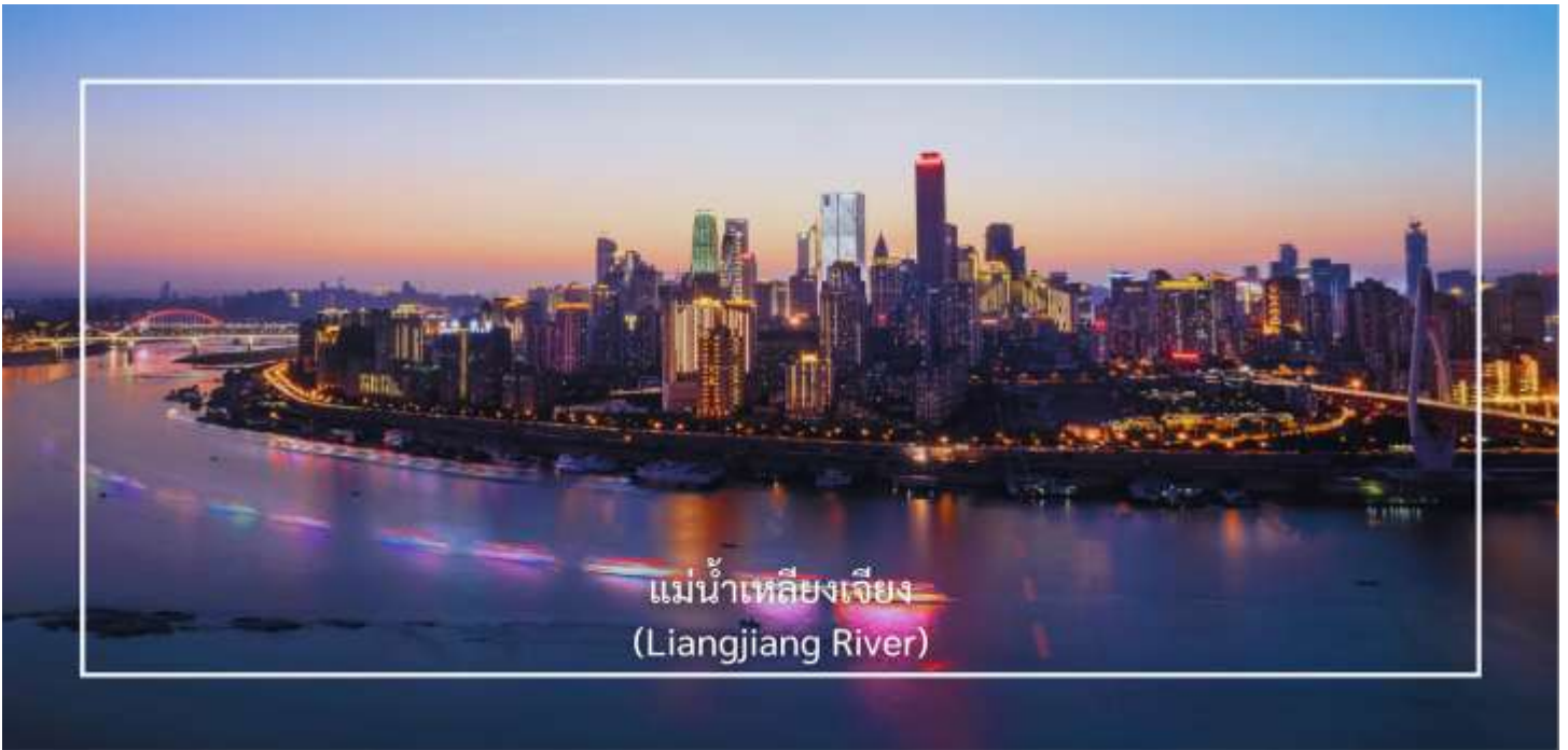
แม่น้ำเหลียงเจียง (Liangjiang River)

ล่องเรือแม่น้ำเหลียงเจียง (Liangjiang Cruise) แม่น้ำเหลียงเจียงคือพื้นที่จุดบรรจบของแม่น้ำทั้งสอง ซึ่งเป็นหนึ่งในมุมมองที่สวยงามที่สุดของเมืองฉงชิ่ง ซึ่งประกอบด้วย แม่น้ำแยงซี (Yangtze River) เป็นแม่น้ำสายที่ยาวที่สุดในจีน และเป็นสายหลักของประเทศ แม่น้ำเจียงหลิง เป็นแม่น้ำสาขาที่สำคัญซึ่งไหลลงสู่แม่น้ำแยงซี พื้นที่ที่แม่น้ำทั้งสองสายนี้มาบรรจบกันมีชื่อว่า “เหลียงเจียง” กิจกรรมล่องเรือสองแม่น้ำ (Two Rivers Cruise) ซึ่งได้รับความนิยมมากในหมู่นักท่องเที่ยว เพราะจะได้ชมเส้นขอบฟ้าของฉงชิ่งยามค่ำคืน ตึกระฟ้า แสงไฟเมือง และวิวริมแม่น้ำที่สวยงามเป็นเอกลักษณ์