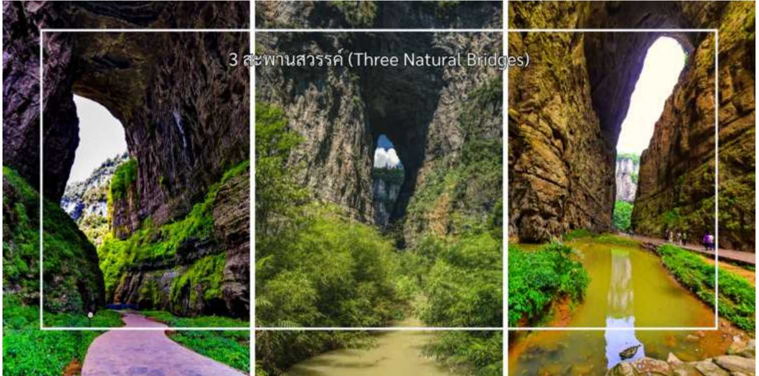
3 สะพานสวรรค์ (Three Natural Bridges)

3.Heilong Bridge (สะพานเฮยหลง) สะพานเฮยหลงอยู่ในส่วนที่แคบที่สุดของอุทยาน จึงมีบรรยากาศที่ค่อนข้างมืดทึบ แต่ก็มีเสน่ห์เฉพาะตัว มีความสูง 223 เมตร สมควรแก่เวลานำท่านเดินทูลู่ร้านอาหารมือเย็น