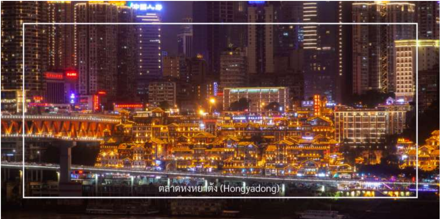
ตลาดหงหยาดัง (Hongyadong)

จากนั้นเดินทางไปยัง ตลาดหงหยาดัง (Hongyadong) หรือที่เรียกว่า "Hongya Cave" เป็นสถานที่ท่องเที่ยวที่มีชื่อเสียงในเมืองฉงชิ่ง โดยตั้งอยู่ริมแม่น้ำแยงซี มีบรรยากาศที่เต็มไปด้วยวัฒนธรรมและประวัติศาสตร์ ตลาดหงหยาดังเป็นพื้นที่ที่มีอาคารแบบดั้งเดิมที่สร้างขึ้นในสไตล์สถาปัตยกรรมแบบชิโน-ทิเบต โดยมีร้านค้า ร้านอาหาร และบาร์จำนวนมาก ที่นี่คุณสามารถลิ้มลองอาหารท้องถิ่นที่อร่อย เช่น ฮอทพอตหงชิ่ง (Chongqing Hot Pot) และขนมพื้นเมืองอื่นๆ นอกจากนี้ ตลาดหงหยาดังยังมีวิวทิวทัศน์ที่สวยงาม โดยเฉพาะในช่วงเย็นเมื่อไฟประดับส่องสว่าง ที่ทำให้บรรยากาศมีความโรแมนติกและน่าตื่นตาตื่นใจ คุณสามารถเดินเล่นตามทางเดินที่มีการจัดแสดงงานศิลปะและสินค้าท้องถิ่น