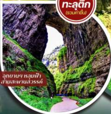
อุทยานฯ หลุมฟ้า สามสะพานสวรรค์