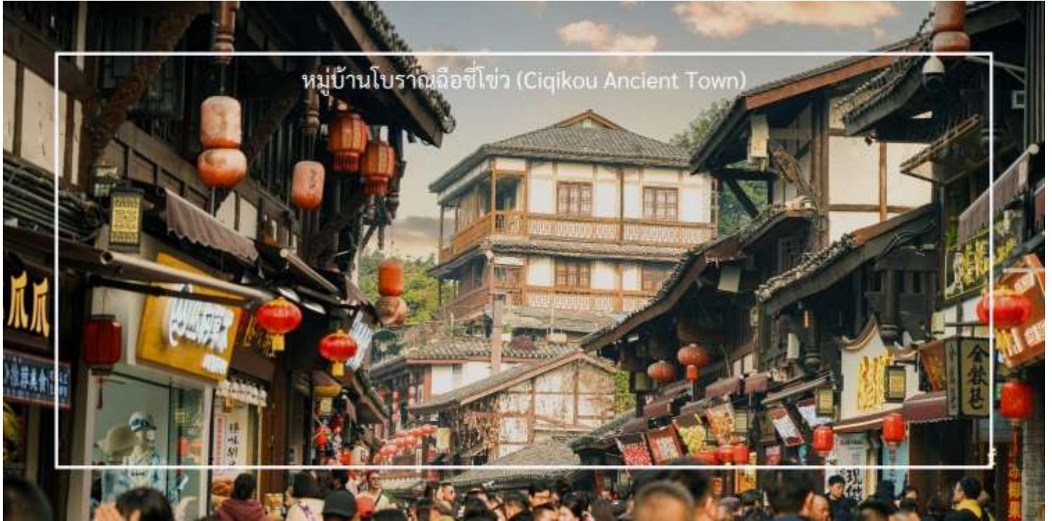
หมู่บ้านโบราณฉีโข่ว (Ciqikou Ancient Town)

พื้นเมือง มีชื่อเสียงด้านอาหารท้องถิ่น เช่น ขนมจีบ (dumplings), หมูกรอบ (crispy pork) และของหวานจีนต่างๆ นักท่องเที่ยวสามารถลิ้มรสอาหารที่หลากหลายได้ที่นี้ บรรยากาศในเมืองโบราณฉีโข่วเต็มไปด้วยความมีชีวิตชีวา