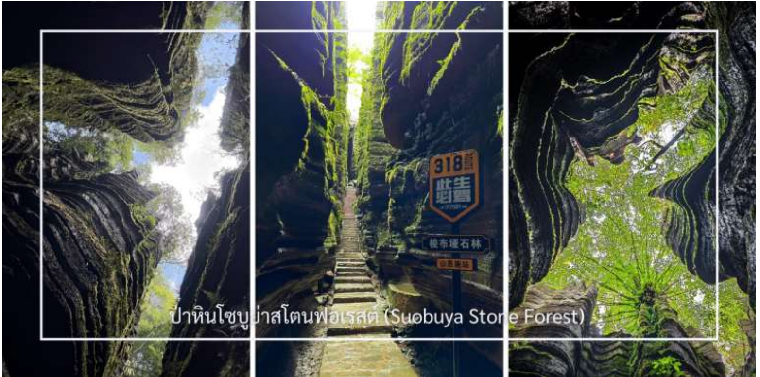
ป่าหินโซบูย่าสโตนฟอเรสต์ (Suobuya Stone Forest)