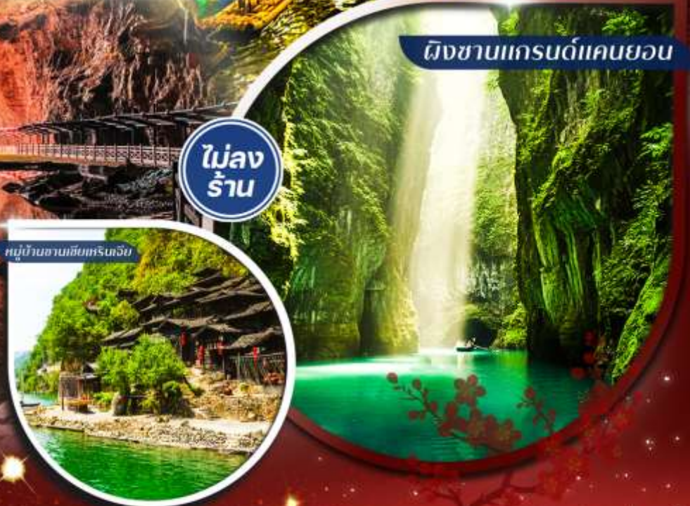
ผิงชานแกรนด์แคนยอน