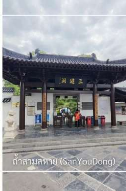
ถ้ำสามสหาย (SanYouDong)