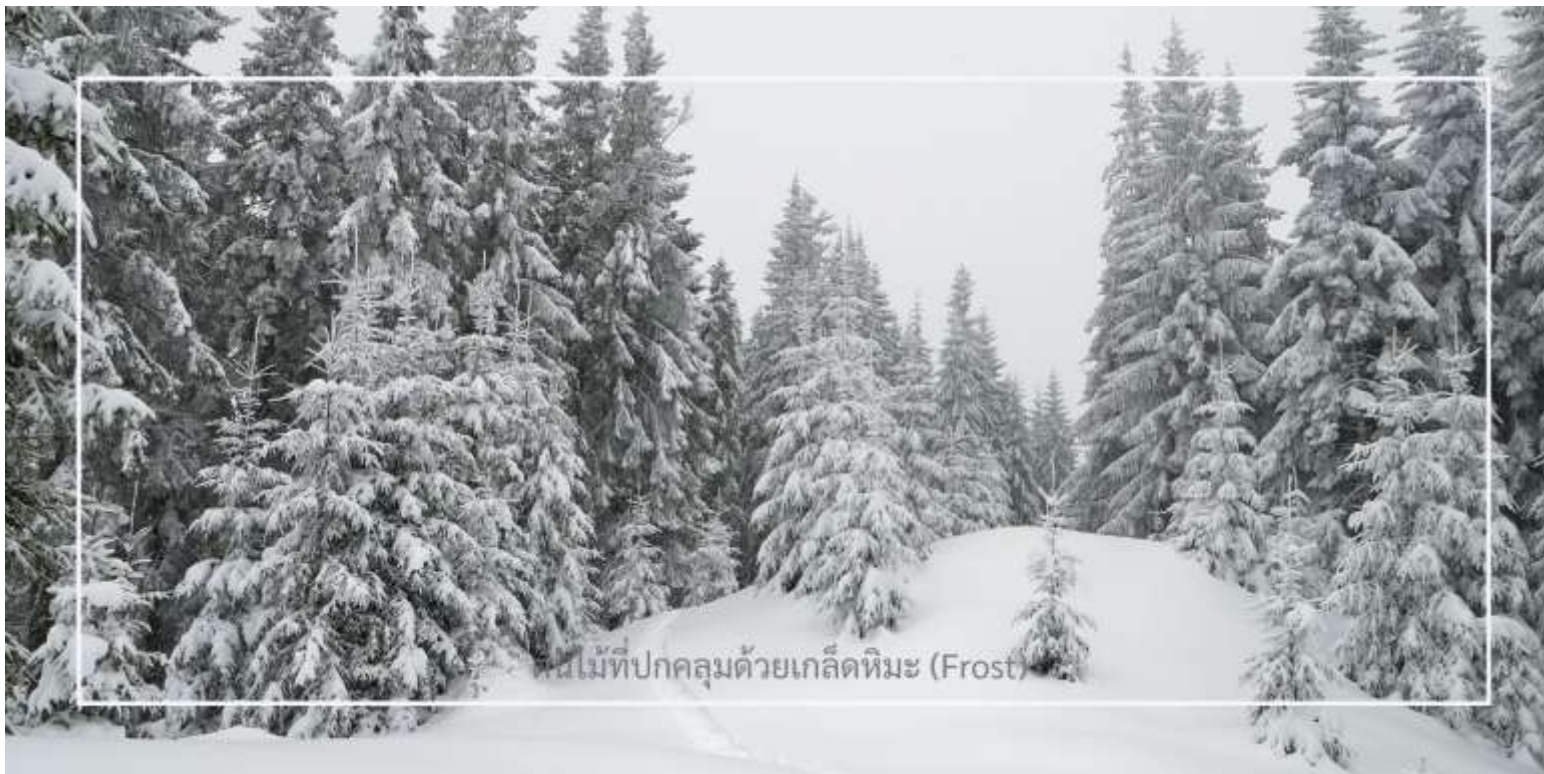
ต้นไม้ที่ปกคลุมด้วยเกล็ดหิมะ (Frost)

ยาบูลี (Yabuli) เมืองตากอากาศชื่อดังทางตอนเหนือของจีน ตลอดเส้นทาง ท่านจะได้เพลิดเพลินกับทัศนียภาพของฤดูหนาวที่งดงาม ราวกับฉากในนิยาย ท่ามกลางต้นไม้ที่ปกคลุมด้วยเกล็ดหิมะ (Frost) ระเบียบระยับราวคริสตัล สองข้างทางแต่งแต้มไปด้วยหิมะขาวนวล เป็นบรรยากาศที่หาได้ยากและงดงามจับใจในแบบเฉพาะของดินแดนภาคตะวันออกเฉียงเหนือของจีน