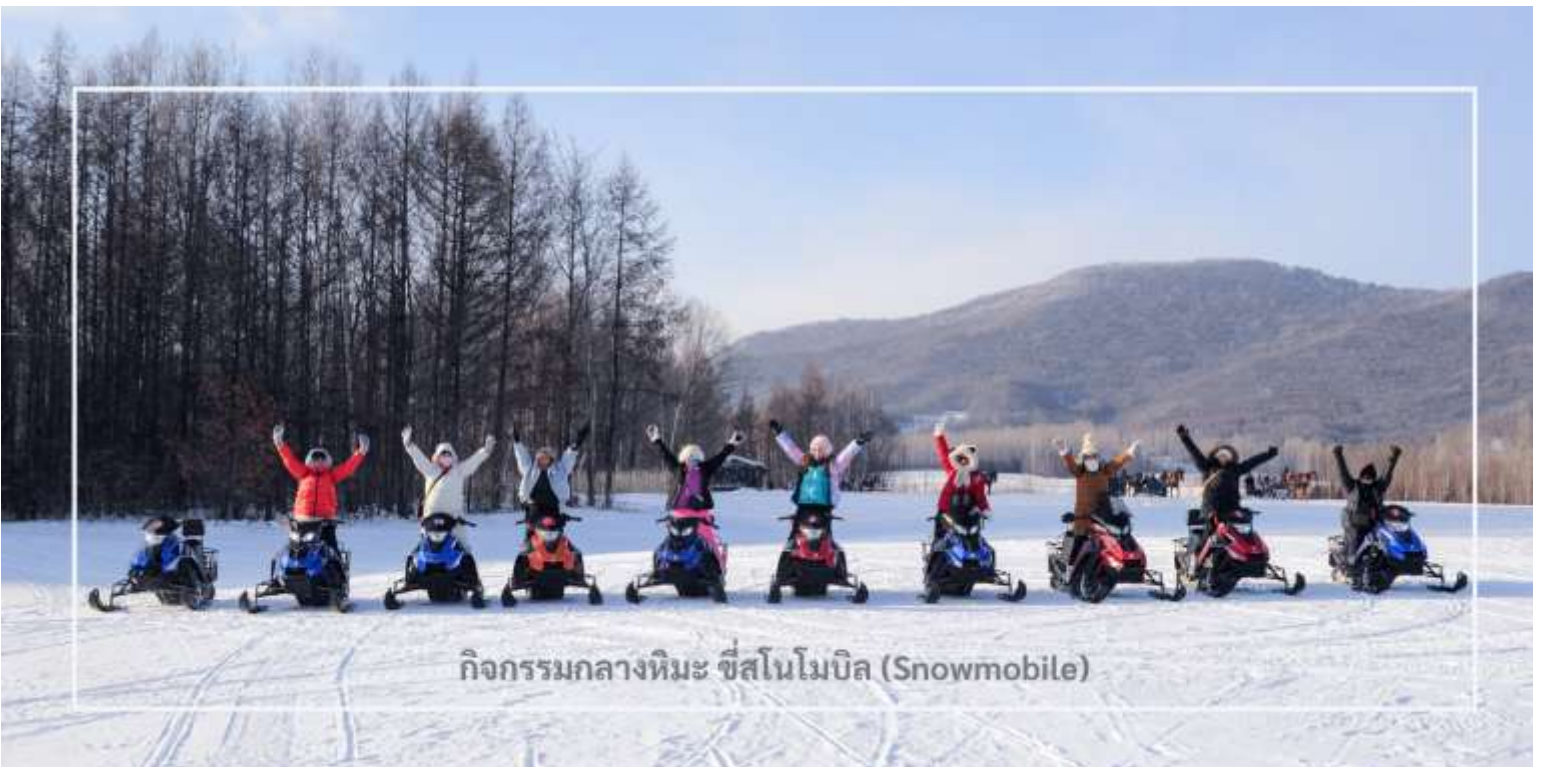
กิจกรรมกลางหิมะ ขับสโนว์โมบิล (Snowmobile)

หลังอาหารนำท่านเดินทางต่อประมาณ 30 นาที สนุกสนานกับอีกหนึ่งกิจกรรมยอดนิยมของฤดูหนาว นั่นคือการขับสโนว์โมบิล (Snowmobile) สัมผัสความตื่นเต้นเร้าใจ กับการขับเคลื่อนฝ่าสนามหิมะอันกว้างใหญ่ท่ามกลางบรรยากาศของภูเขาและป่าสนที่ปกคลุมด้วยหิมะขาวราวกับเทพนิยาย อีกหนึ่งกิจกรรมสุดมันส์ที่ไม่ควรพลาดในการผจญภัยท่ามกลางฤดูหนาวของเมืองหนาวสุดขีด (รวมค่ากิจกรรม ใช้เวลาประมาณ 20-30 นาที)