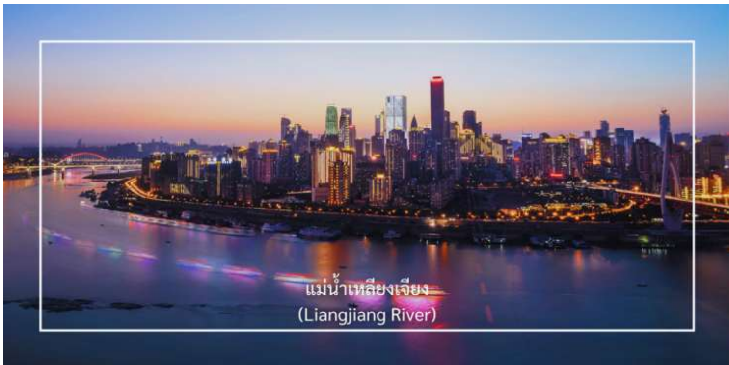
แม่น้ำเหลียงเจียง (Liangjiang River)