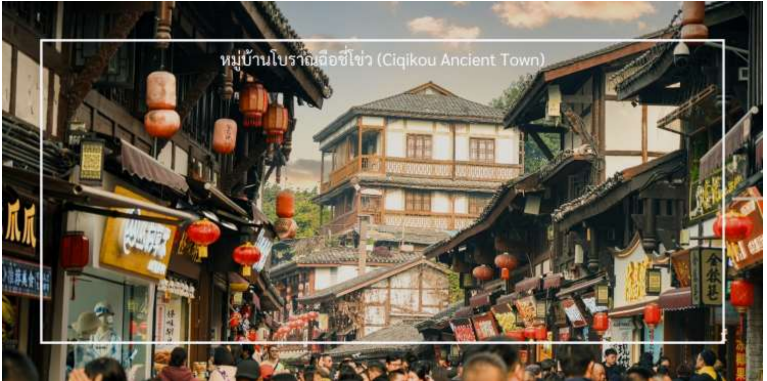
หมู่บ้านโบราณฉือซีโซ่ว (Ciqikou Ancient Town)

จากนั้นนำท่านเดินทางไปที่ยวซม หมู่บ้านโบราณฉือซีโซ่ว (Ciqikou Ancient Town) เป็นหมู่บ้านโบราณที่มีเสน่ห์และเต็มไปด้วยประวัติศาสตร์ มีประวัติความเป็นมายาวนานกว่า 1,000 ปี ซึ่งเคยเป็นศูนย์กลางการค้าและการคมนาคมทางน้ำในสมัยโบราณ เมืองนี้เป็นที่รู้จักในฐานะหมู่บ้านการค้าขายที่สำคัญในยุคศตวรรษที่ 18-19 มีสถาปัตยกรรมที่สวยงาม