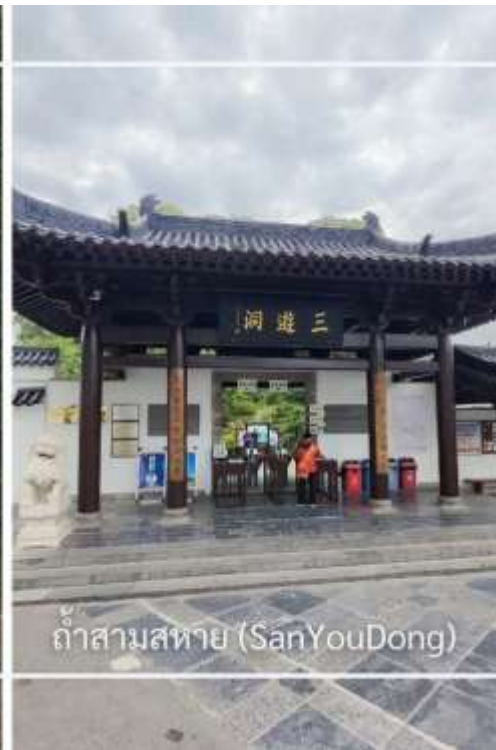
ถ้ำสามสหาย (SanYouDong)