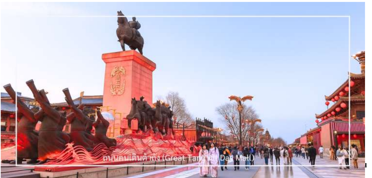
ถนนคนเดินต้าถัง (Great Tang All Day Mall)

นำท่านเดินทางสู่ ถนนคนเดินต้าถัง (Great Tang All Day Mall) แลนด์มาร์คยอดนิยมของเมืองซีอาน ตั้งอยู่บริเวณตรงข้ามกับ เจดีย์ห่านป่าใหญ่ ถนนสายนี้ถูกออกแบบให้มีกลิ่นอายของเมืองฉางอันในสมัยราชวงศ์ถัง ตลอดสองฝั่งเรียงรายด้วยอาคารสไตล์จีน ร้านค้า ร้านอาหาร คาเฟ่ และมุมถ่ายรูปมากมาย ในช่วงค่ำจะมีการแสดงตามจุดต่าง ๆ ตลอดแนวถนน ทั้งการแสดงดนตรี การรำแบบจีน และโชว์แสงสีที่ช่วยเพิ่มความคึกคักให้กับบรรยากาศยามค่ำคืน หรือจะเช่าชุด ฮั่นฝู แต่งตัวถ่ายรูป เดินเล่นภายในถนนคนเดิน ให้ความรู้สึกเหมือนได้ย้อนเวลากลับไปในยุคราชวงศ์ถังอีกครั้ง