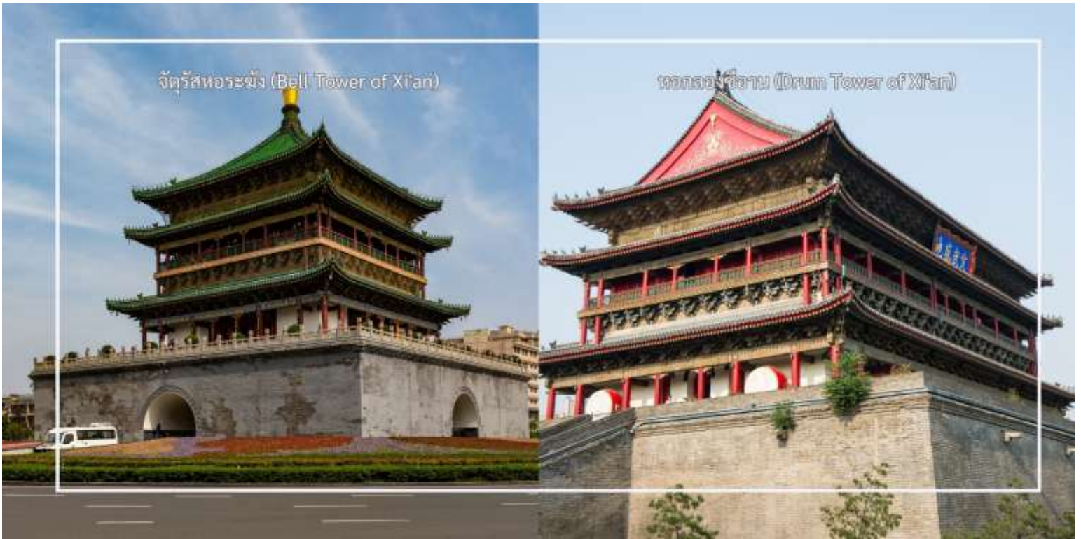
จัตุรัสพระฆัง (Bell Tower of Xi'an)