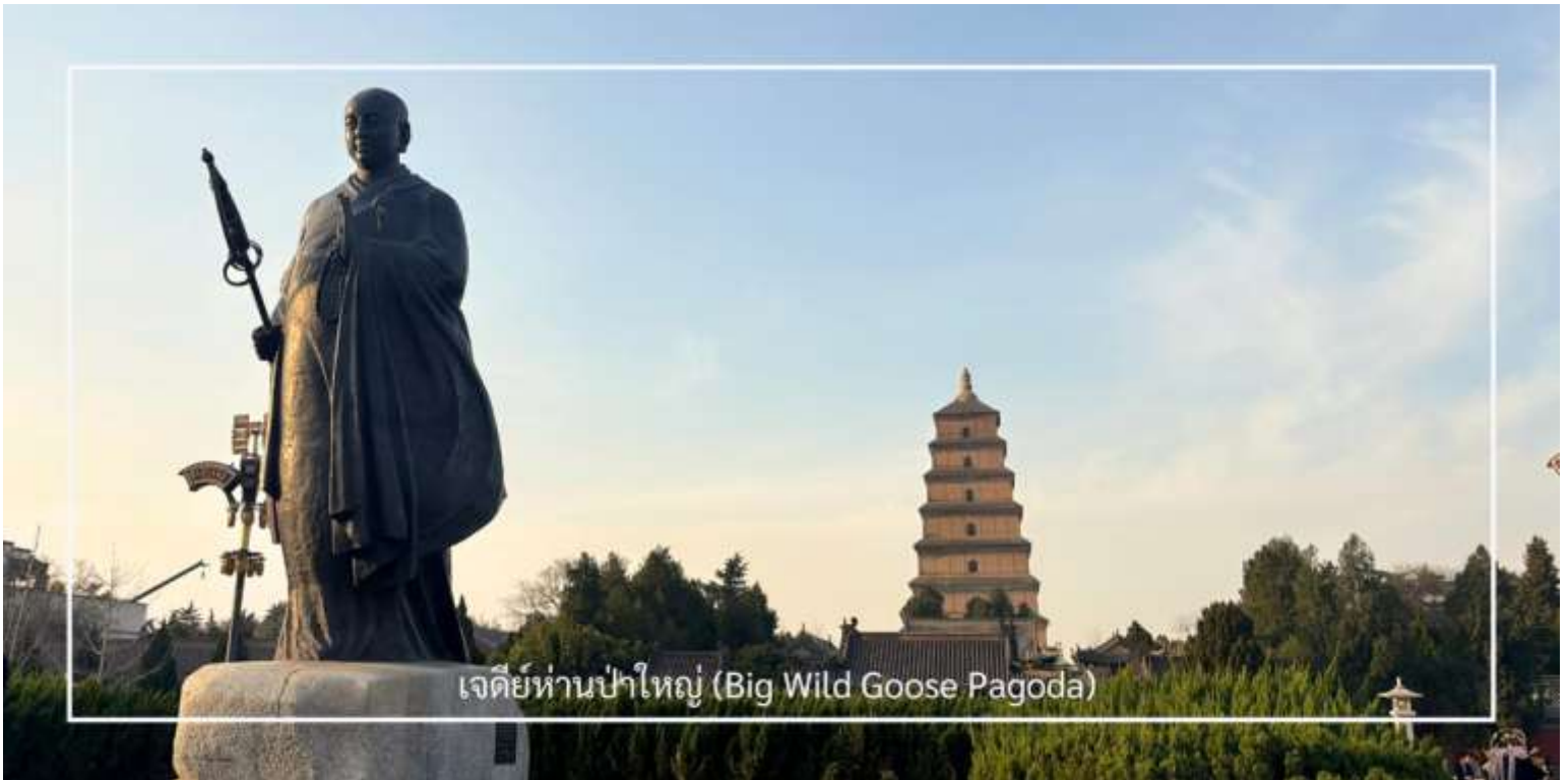
เจดีย์ห่านป่าใหญ่ (Big Wild Goose Pagoda)

นำท่านเดินทางสู่ ถนนคนเดินต้าถัง (Great Tang All Day Mall) แลนด์มาร์คยอดนิยมของเมืองซีอาน ตั้งอยู่บริเวณตรงข้ามกับ เจดีย์ห่านป่าใหญ่ ถนนสายนี้ถูกออกแบบให้มีกลิ่นอายของเมืองฉางอันในสมัยราชวงศ์ถัง ตลอดสองฝั่งเรียงรายด้วยอาคารสไตล์จีน ร้านค้า ร้านอาหาร คาเฟ่ และมุมถ่ายรูปมากมาย ในช่วงค่ำจะมีการแสดงตามจุดต่าง ๆ ตลอดแนวถนน ทั้งการแสดงดนตรี การรำแบบจีน และโชว์แสงสีที่ช่วยเพิ่มความคึกคักให้กับบรรยากาศยามค่ำคืน หรือจะเช่าชุด ฮั่นฝู แต่งตัวถ่ายรูป เดินเล่นภายในถนนคนเดิน ให้ความรู้สึกเหมือนได้ย้อนเวลากลับไปในยุคราชวงศ์ถังอีกครั้ง