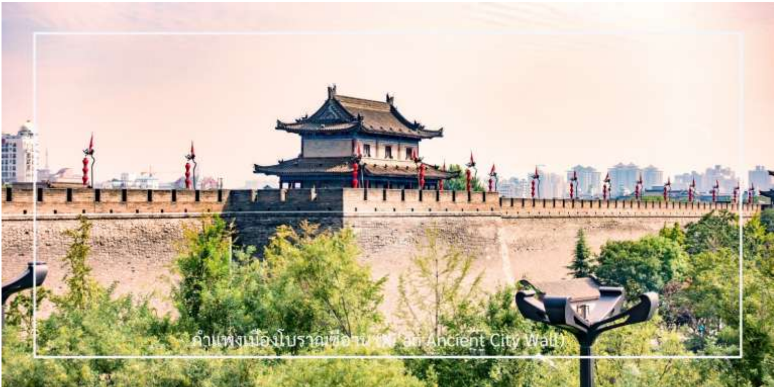
กำแพงเมืองโบราณซีอาน (Xi'an Ancient City Wall)

จากนั้นนำท่าน ผ่านชมจัตุรัสหอกลองและหอรฆังซีอาน (Xi'an Drum & Bell Tower) แลนด์มาร์คสำคัญที่ตั้งอยู่ใจกลางเมืองซีอาน และถือเป็นสัญลักษณ์ทางประวัติศาสตร์ของเมืองหอรฆังและหอกลองสร้างขึ้นในสมัยโบราณ เพื่อใช้บอกเวลาและส่งสัญญาณเตือนภัยให้กับผู้คนภายในเมือง โดยในอดีตจะตีระฆังในช่วงเช้า และตีกลองในช่วงค่ำ จนได้รับการขนานนามว่าเป็น “ระฆังรุ่งอรุณ กลองยามค่ำ” ปัจจุบันสถานที่แห่งนี้ยังคงได้รับการอนุรักษ์ไว้เป็นอย่างดี และเป็นอีกหนึ่งจุดสำคัญที่นักท่องเที่ยวนิยมมาเก็บภาพบรรยากาศใจกลางเมืองซีอาน