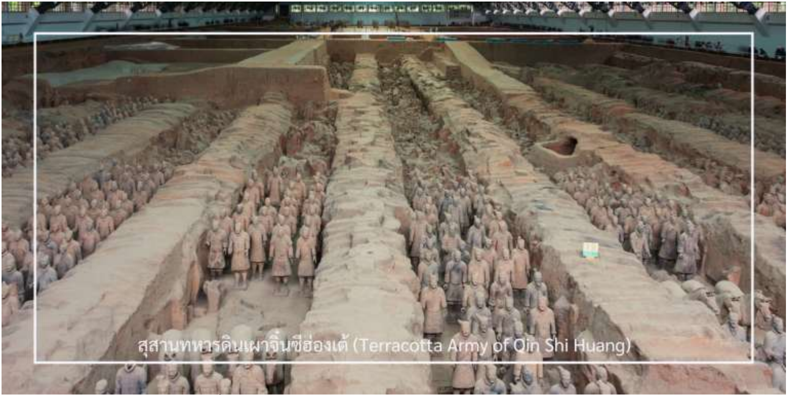
สุสานทหารดินเผาจีนซีฮ่องเต้ (Terracotta Army of Qin Shi Huang)

บริเวณใกล้เคียงเป็นที่ตั้งของ พิพิธภัณฑ์ ซึ่งจัดแสดงกองทัพทหารดินเผาและโบราณวัตถุต่างๆ รวมถึงข้อมูลประวัติศาสตร์เกี่ยวกับจักรพรรดิฉินซีและยุคราชวงศ์ฉิน ภายในแบ่งโซนจัดแสดงอย่างเป็นระบบ นำเสนอเรื่องราวการค้นพบ กระบวนการขุดค้น และการฟื้นฟูงานศิลปะโบราณ ท่านจะได้ชมทหารดินเผาที่ยังอยู่ในสภาพสมบูรณ์ รวมถึงรถศึกและม้าโบราณอย่างใกล้ชิด