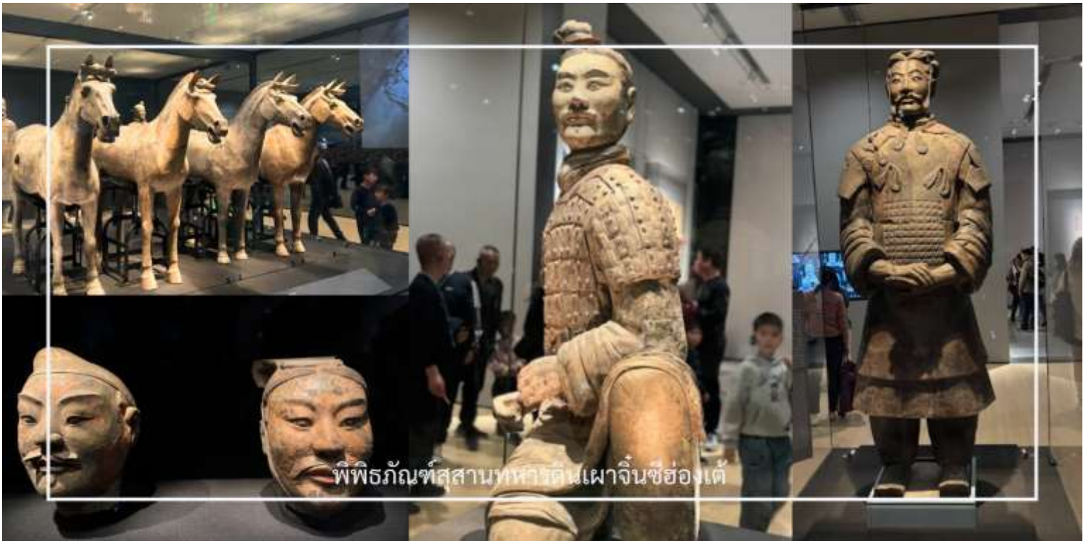
พิพิธภัณฑ์สถานทหารดินเผาจีนซีฮองใต้

สมควรแก่เวลา นำท่านเดินทางสู่ เมืองซีอาน (Xi'an) ใช้เวลาเดินทางประมาณ 1 ชั่วโมง เมืองหลวงเก่าแก่ของมณฑลส่านซี และเป็นหนึ่งในเมืองประวัติศาสตร์สำคัญของจีน ที่เคยเป็นเมืองหลวงของหลายราชวงศ์ เช่น ฉิน ฮั่น และถัง จึงเต็มไปด้วยเรื่องราวทางประวัติศาสตร์และโบราณสถานสำคัญมากมาย