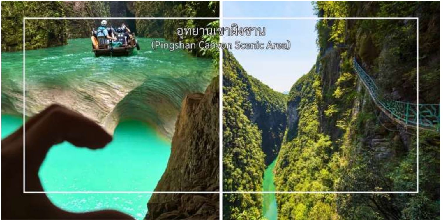
อุทยานเขาผิงซาน (Pingshan Canyon Scenic Area)