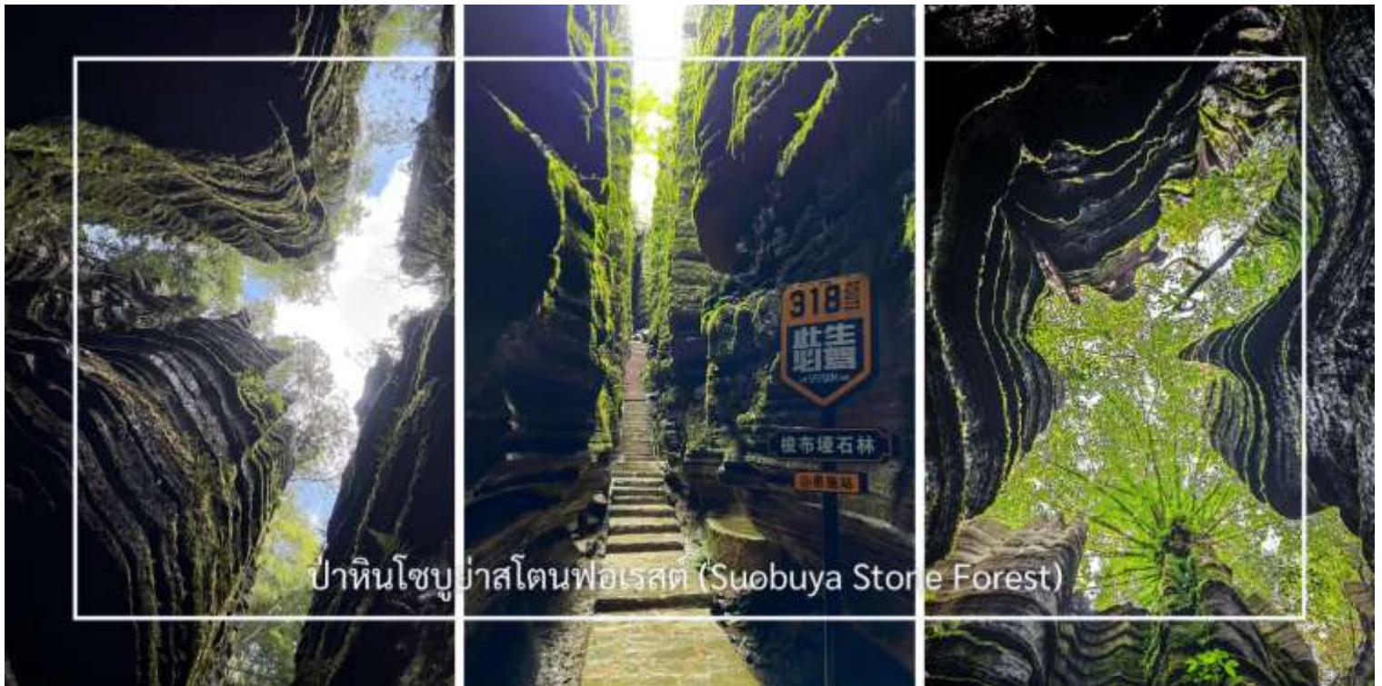
ป่าหินโซบูย่าสโตนฟอเรสต์ (Suobuya Stone Forest)

สมควรแก่เวลานำท่านเดินทางกลับอู่ซาง (ใช้เวลาประมาณ 3 ชั่วโมง)