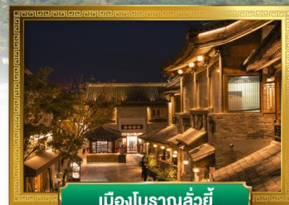
เมืองโบราณลั่วอี้