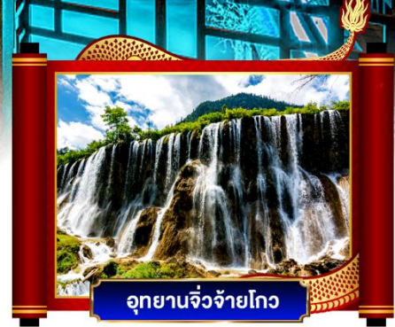
อุทยานจิวจ้ายโกว