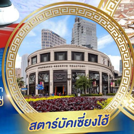
สตาร์บัคเซี่ยงไฮ้