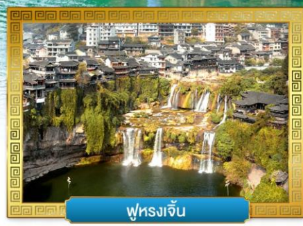
ฟูหลงเจิ้น