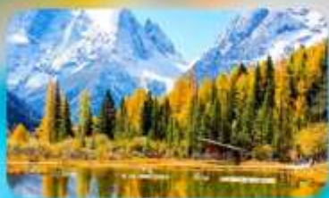
กูเวาสี้ครุณี