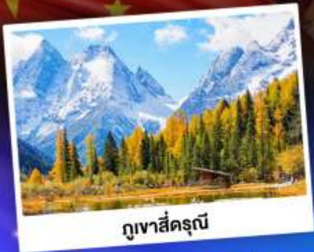
กุเขาสีดรุณี