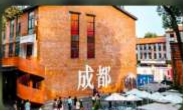
ดงเจียวจี้