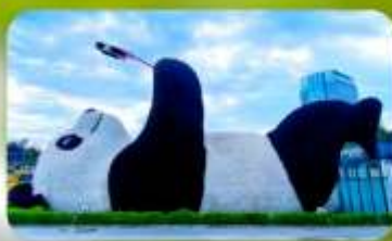
หมีแพนด้าเซลฟ์