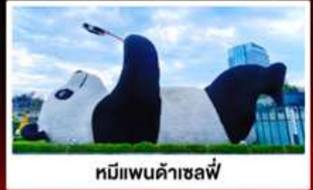
หมีแพนด้าเซลฟ์