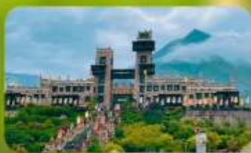
หมู่บ้านโบราณชนเผ่าเซียง