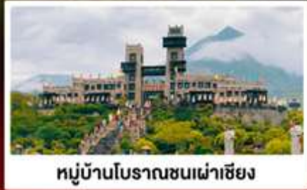
หมู่บ้านโบราณชนเผ่าซียง