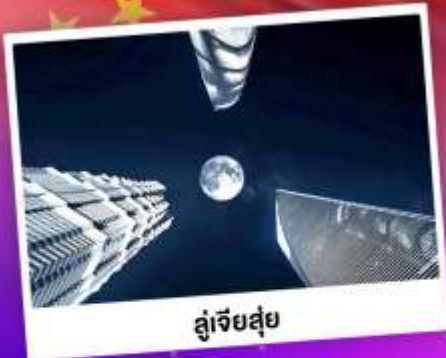
กระเป๋าเดินทาง