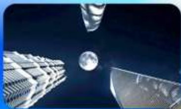
ลู่อิจยส์