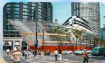
เรือทลยส์วิตคอง