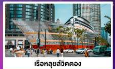
ร้านอาหาร