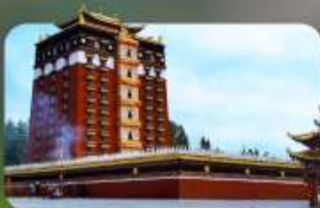
หอพระมิเรลอป่า