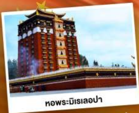
ทอพระมีริเลอปา