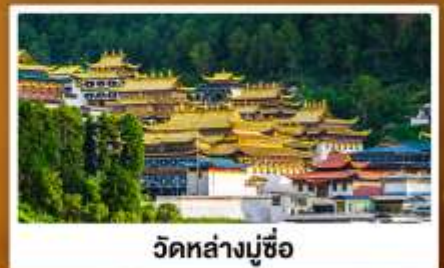
วัดหล่างมูซื่อ