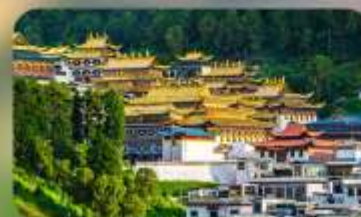
วัดหล่างมู่ซื่อ