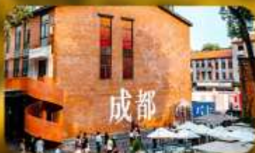
ดงเจียวจี้

HOLIDAY INN EXPRESS HOTEL หรือเทียบเท่า 4 คาว