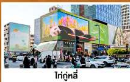
ไท่กู๋หลี่