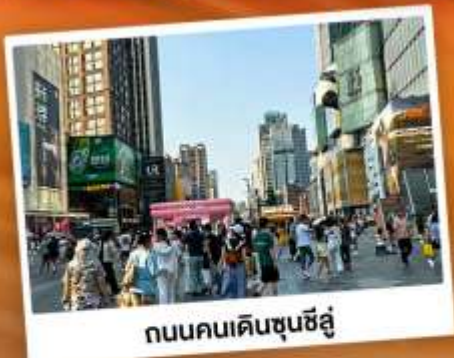
ถนนคนเดินชุนชี่อู่

"สวีทเซอร์แลนด์เมือง" แคนมิงกร แหล่งท่องเที่ยวทางธรรมชาติระดับ 4A