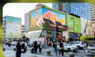
ไท่กู่หลี่