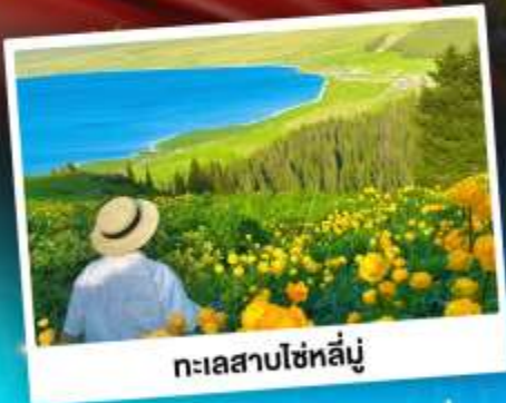
ทะเลสาบไซหลินู่