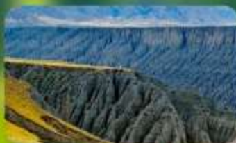
แกรนด์แคนยอนคู่ชานจื่อ