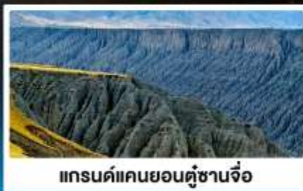
แกรนด์แคนยอนคู้ซานจื่อ