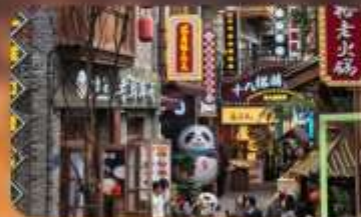
หมู่บ้านสีโอปาที้