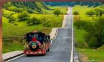
หุบเจานางฟ้า