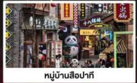
หมู่บ้านสี่牌坊