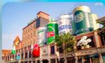
ถนนเบียร์ชิงเต่า