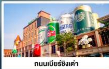
ถนนเบียร์ชิงเต่า