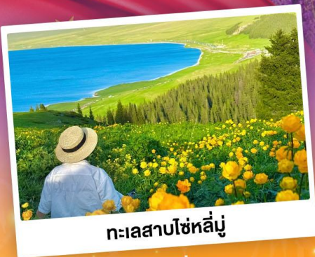
ทะเลสาบไซเหล็่มู

ถ่ายรูปทุ่งดอกลาเวนเดอร์ - ทุงหญ้าคาลาจัน SKY GRASSLAND ทุงหญ้าบรมกโลก