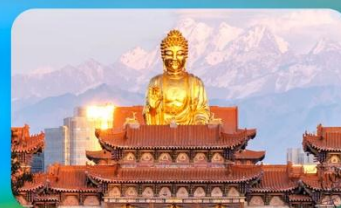
วัดพระใหญ่ทงกงชาน