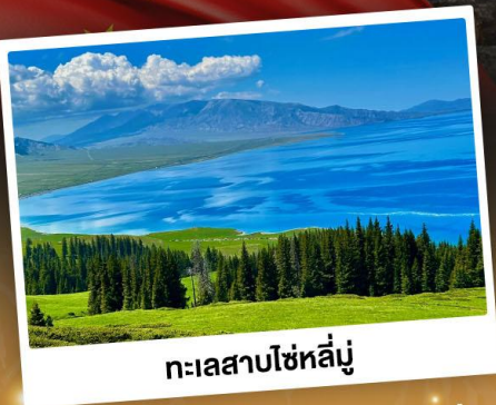
ทะเลสาบไซหลู่

ชมวิวสุดอลังการแบบยุโรปผสมเอเชีย ท่งหญ้าเขียวฉ่ำ ทะเลสาบสีเทอร์ควอยซ์