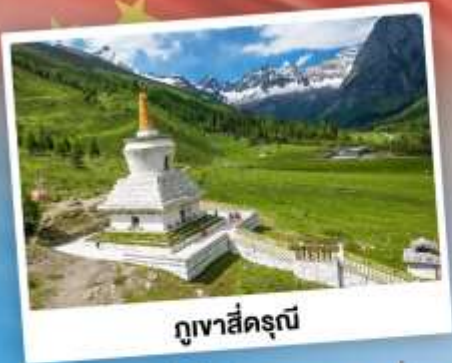
กู๋เจาสื่อตรุณี

เที่ยว 2 อุทยาน กู๋เจาสื่อตรุณี & ปี้ฝิงโกว เดินชมหมีแพนด้าสุดน่ารัก ใกล้ชิดกับแพนด้าแดง