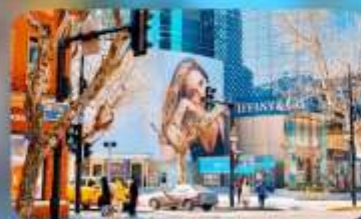
ถนนหอยไห้มิดเคิ้ลไรด์