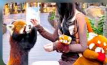
ให้อาหารแพนด้าแดง