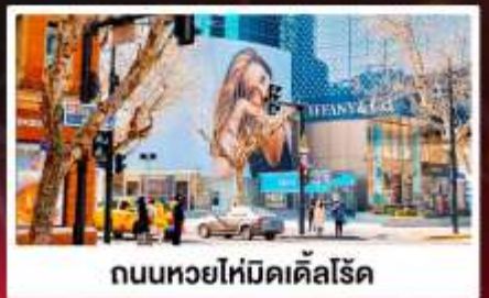
ถนนหยอไห่มีคเคิลส์โรด