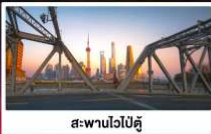
สะพานไวปี้