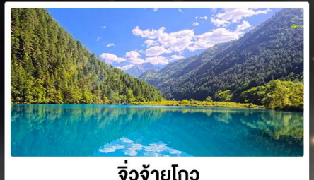
จิ้งจ้ายโกว