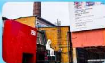
798 Art Zone