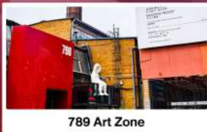
798 Art Zone