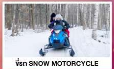
ขี่รถ SNOW MOTORCYCLE