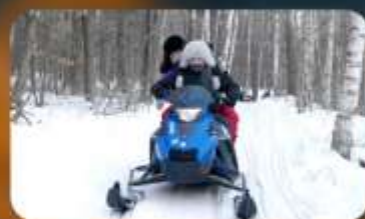
จักรยาน SNOW MOTORCYCLE