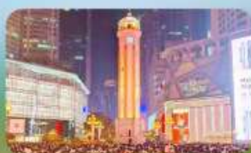
ถนนคนเดินเจียงฟางเป่ย์