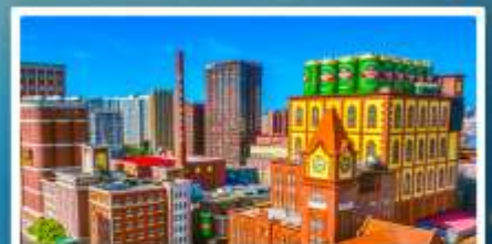
โรงงานเบียร์ซิงเต่า