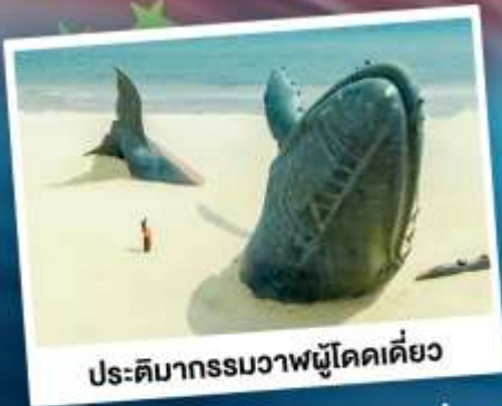
ประติมากรรมวาฬผู้โดดเดี่ยว

เที่ยวเมืองชายทะเลโอปิตตี้ ซิงเต่า - ต้าเหลียน - ฉะเจียงไถ่