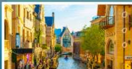
เมืองน้ำเวนิสตะวันออก