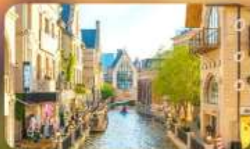
เมืองน้ำเวนิสตะวันออก