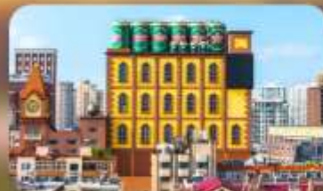
โรงงานเบียร์ซิงเต๋า