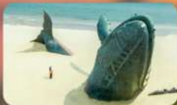
ประติมากรรมวาฬโคดเคี้ยว