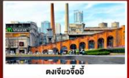
ตงเจียวจ้ออ