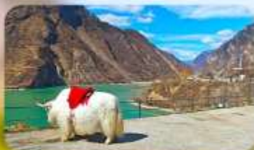
กะเลสาบเค่อซี