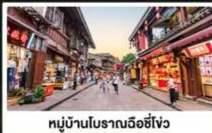
หมู่บ้านโบราณฉือซีโจว