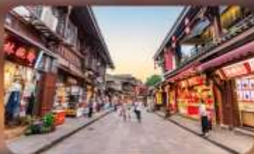
หมู่บ้านโบราณฉือซื่อโจว