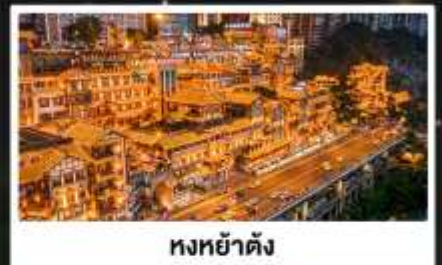
หงหย่าดิง