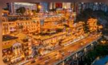
หงหย่าตั้ง